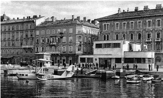
5. Raul Puhali, Hidrodrom, 1932. – 1945. (razglednica, priv. vl.)