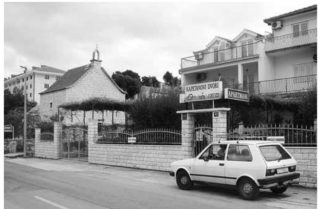
2. Crkvice Gospe pokraj mora