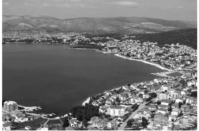
9. Uvala Saldun danas