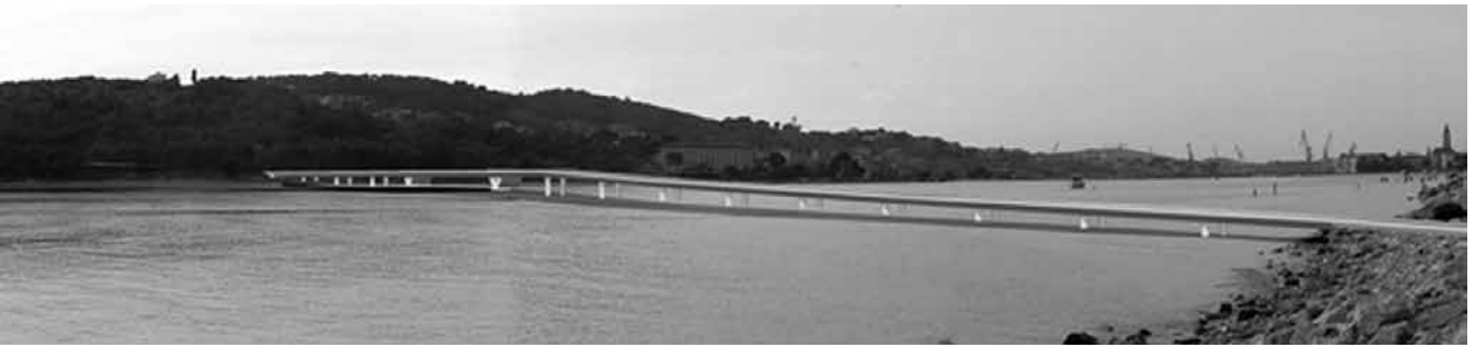
10. Most kopno–otok Čiovo