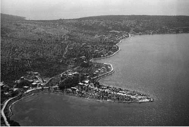
8. Uvala Saldun 1960-ih godina