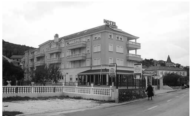
3. Hotel uz crkvu i samostan sv. Lazara