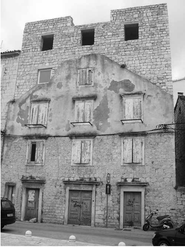
4. Nadogradnja kuće na Trgu sv. Jakova