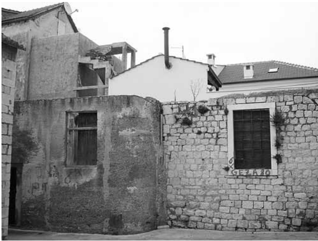
5. Nadogradnja kuće Madirazza uz crkvu sv. Jakova