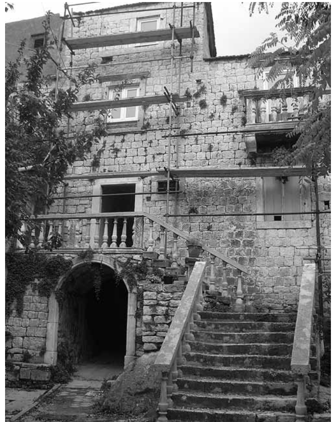
7. Kuća Jura