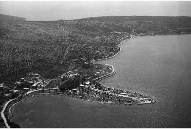
8. Uvala Saldun 1960-ih godina