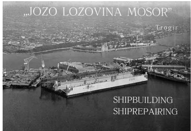
1. Brodogradilište Trogir na punti Cumbrijana

45 BOJANA KARAVIDIĆ, Baština u zamci ideologije i tajkuna, u: Zbornik radova, Suburbium, Petrovaradin , (ur.) Bojana Karavidić, Novi Sad, 2007., 13.