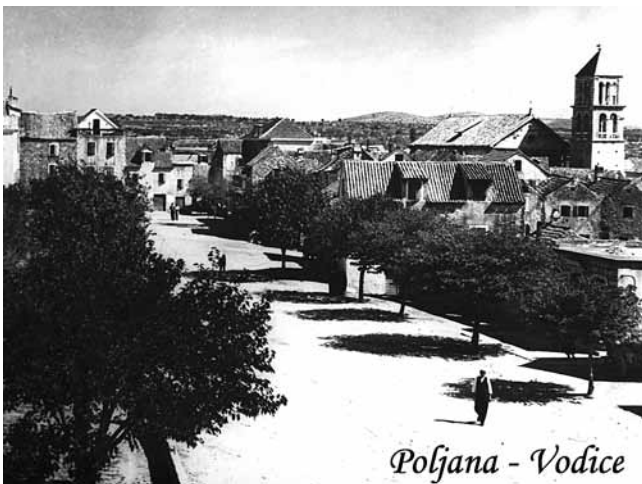
8. Poljana u Vodicama, 1930-ih (privatni arhiv I. Kranjca)