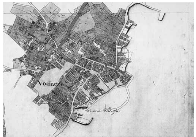
4. Katastarska karta, 1825. (DAS)