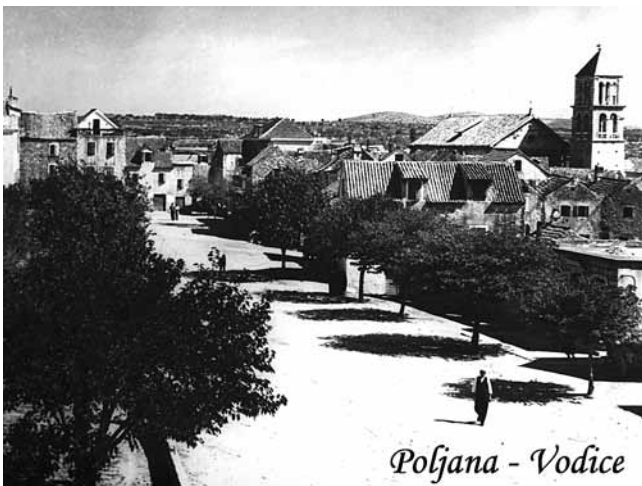
8. Poljana u Vodicama, 1930-ih (privatni arhiv I. Kranjca)