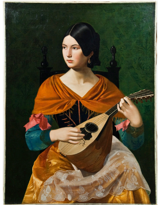
Slika 1 Vjekoslav Karas, Rimljanka s mandolinom , 1845.–1847. Hrvatski povijesni muzej, inv. br. HPM/PMH 8581