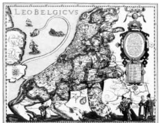
Belgija na karti Michaela Aitzingera iz 1581. godine.