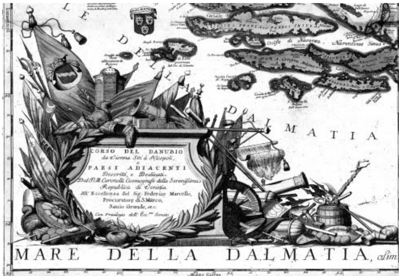
Barokna kartuša s Coronellijeve karte Podunavlja iz 1688. godine inspirirana mletačko-turskim ratovima.