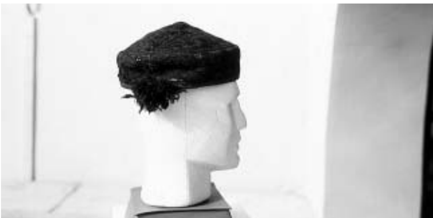
Lička kapa starijeg (stožastog) tipa