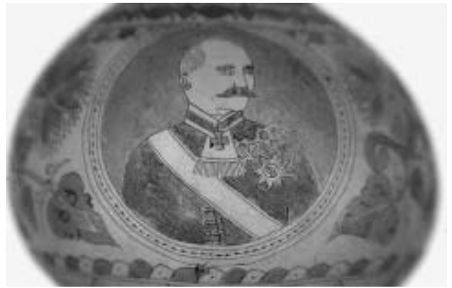
Lik bana Josipa Jelačića na slavnoskoj tikvici