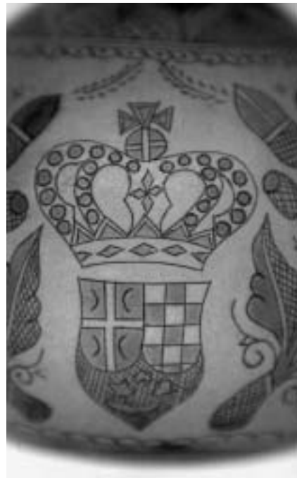
Grb Kraljevine Srba, Hrvata i Slovenaca