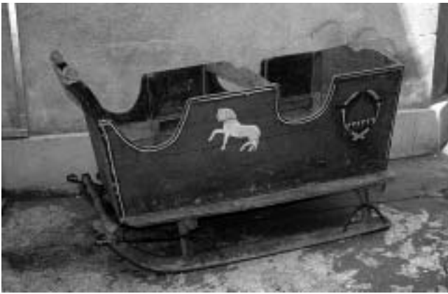
Sanjke otkupljene na Baniji