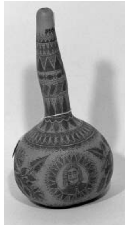
Lik Petra Zrinskoga na slavnoskoj tikvici