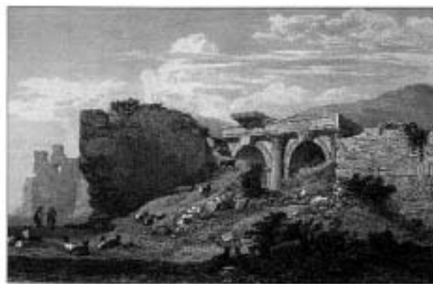
AMERIKA ILLUSTRATIONEN CATTENKAT. REPRODUCTION BY THE AUTHOR