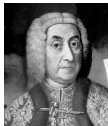
Portret grofa Draškovića, 18. st., Dvorac Trakošćan.