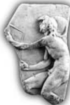
Kairos, 1. st. pr. Kr., Samostan sv. Nikole, Trogir.

In conclusion, the author indicates global guidelines that, within tourist offer, both enable preservation of the resources of cultural heritage and open up the ways to guarantee the authenticity, integrity, and quality of the cultural and tourist product.