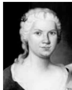
Portret dame, 18. st.