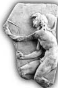
Kairos, 1. st. pr. Kr., Samostan sv. Nikole, Trogir.

In conclusion, the author indicates global guidelines that, within tourist offer, both enable preservation of the resources of cultural heritage and open up the ways to guarantee the authenticity, integrity, and quality of the cultural and tourist product.