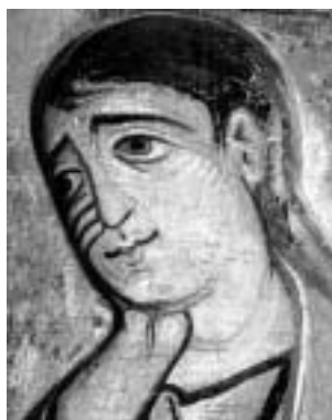
Sv. Ivan, detalj raspela, 12. st., Crkva sv. Frane, Zadar.