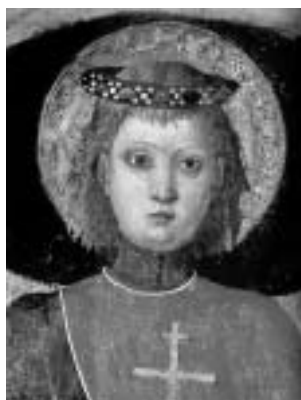
L. Dobričević: Sv. Julijan, 1460., Crkva Gospe od Danača, Dubrovnik.