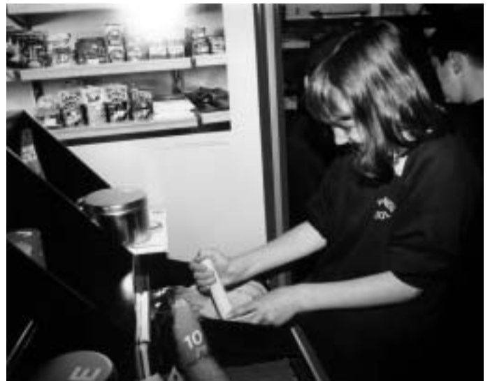
The Discovery Room, Izložba: Discovering Japan , Royal Museum of Scotland, Velika Britanija.