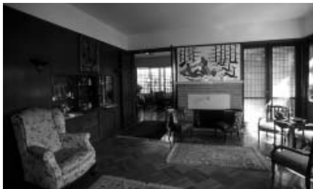
Vila Heinrich, interijer, dnevni boravak, današnji izgled.