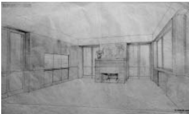
Vila Heinrich, interijer, dnevni boravak, inv. br. MGZ 7900.