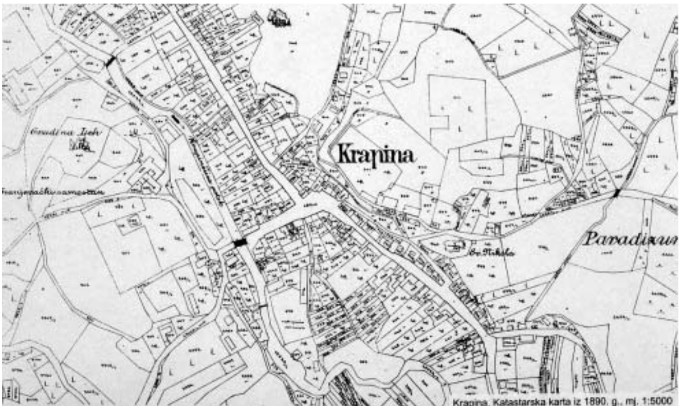
Krapina, katastarska karta iz 1890. g. (Hrvatski državni arhiv u Zagrebu, Kartografska zbirka).