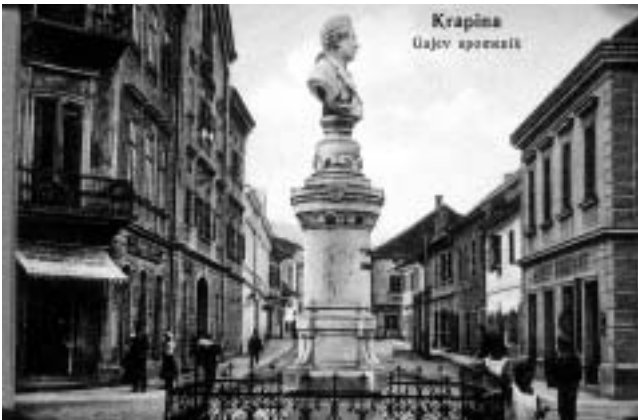
Veduta Krapine, početkom 19. st. (Hrvatski državni arhiv u Zagrebu, Grafička zbirka).