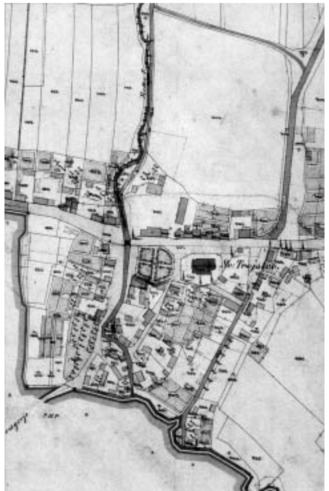
Donja Stubica, katastarska karta iz 1861. g. (Hrvatski državni arhiv u Zagrebu, Kartografska zbirka).