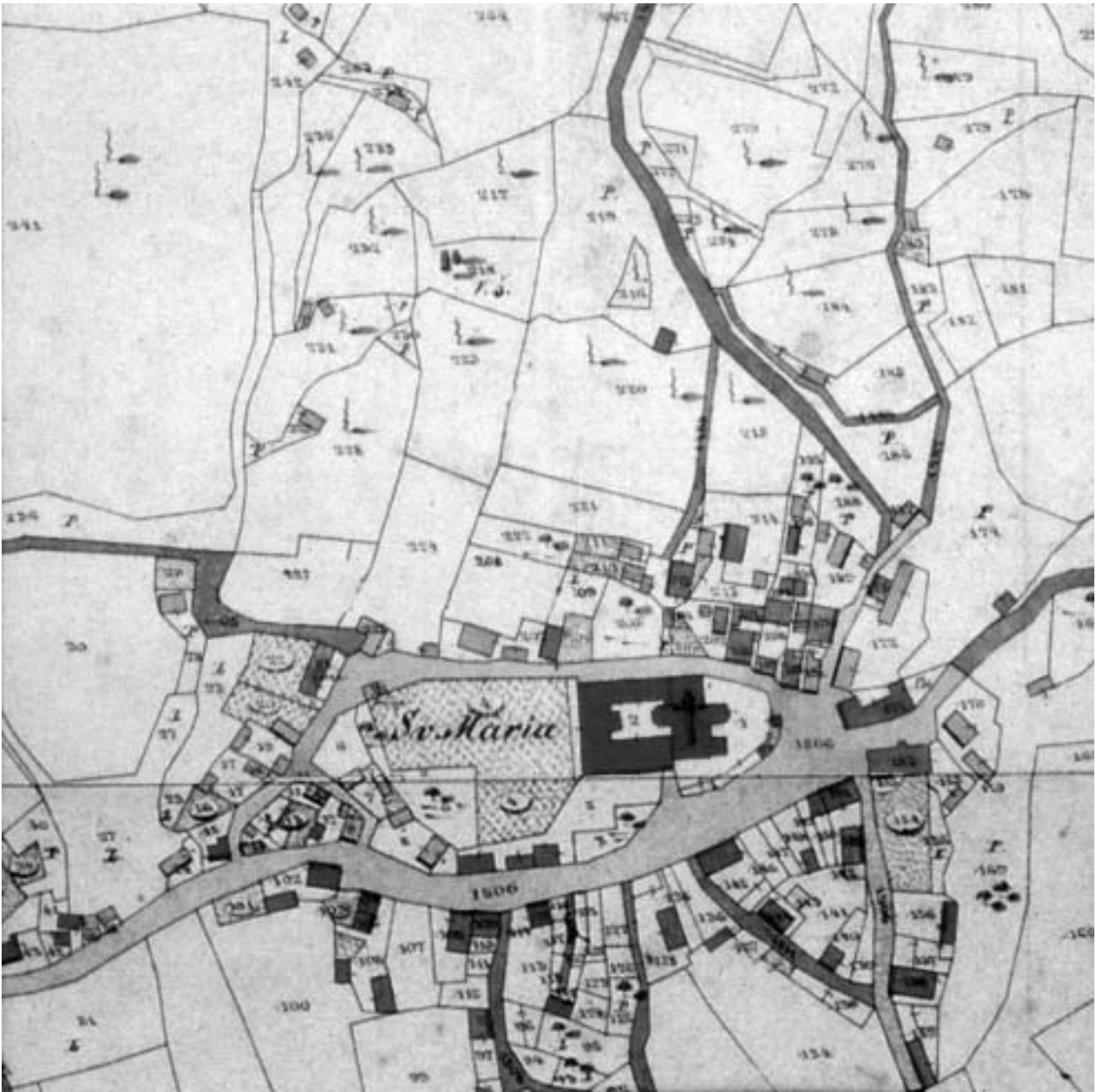
Klanjec, katastarska karta iz 1861. g. (Hrvatski državni arhiv u Zagrebu, Kartografska zbirka).