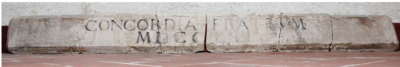
Slika 15 Originalni natpis s pročelja kuće Sasso