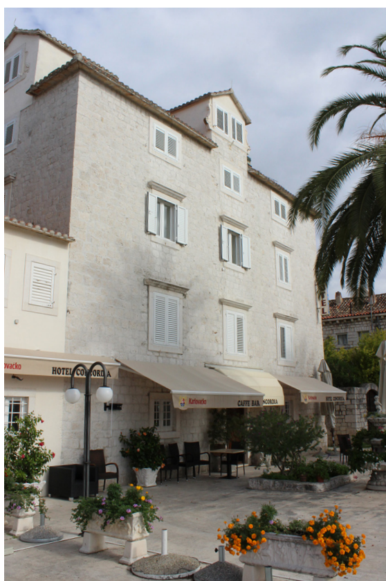
Slika 16 Hotel Concordia