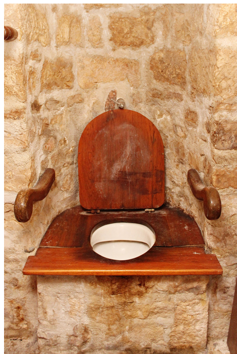
Slika 20 Kameni nužnik iz palače Garagnin-Fanfogna