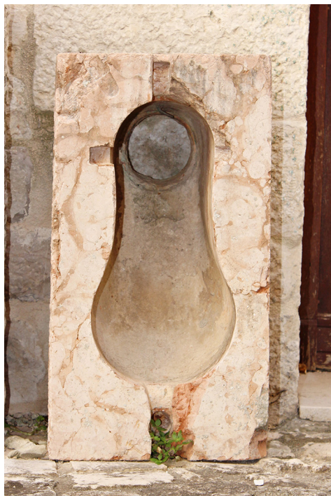
Slika 19 Kamena školjka nužnika iz sklopa Dragazzo