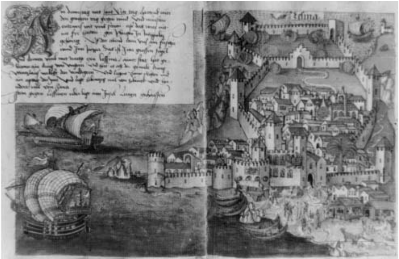
Konrad von Grünenberg, Veduta Hvara iz 1486. g.