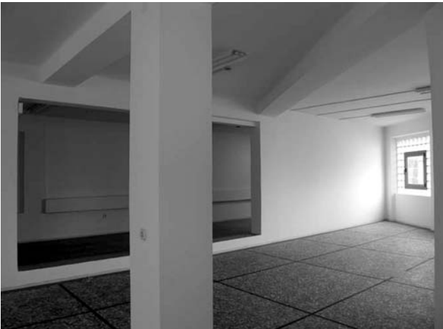
12. Državni arhiv Rijeka, Vodovodna ulica 2, Rijeka, aluminijska prozorska bravarija, sačuvani podni taraco