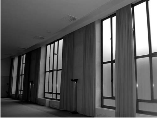
4. Hrvatski kulturni dom, Strossmayerova ulica 1, Rijeka, ophodni hodnik oko velike dvorane s aluminijskom prozorskom bravarijom i novim tapisonom na podu