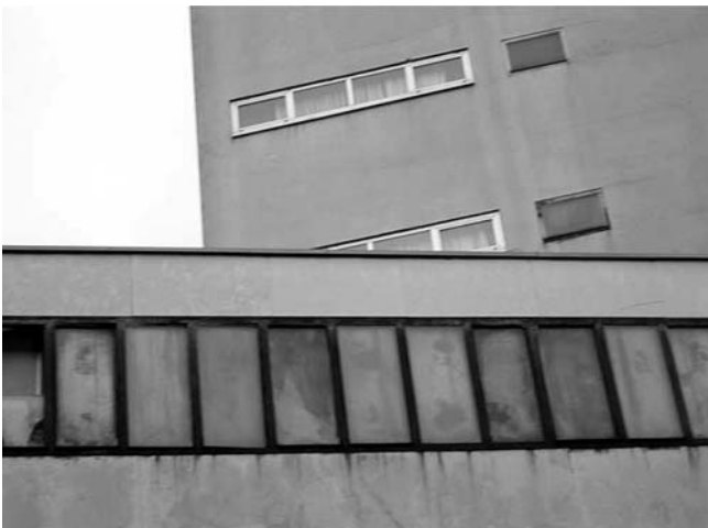
6. Hotel Neboder, Strossmayerova ulica 1, Rijeka, detalji pročelja (obnovljena i neobnovljena bravarija prozora)