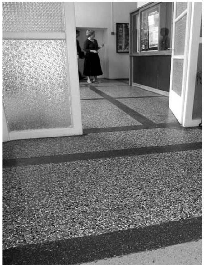
15. Građevinski fakultet Rijeka, Viktora Cara Emina 5, Rijeka, sačuvani taraco, drvenarija ulaznih vrata i unutrašnjih pregrada