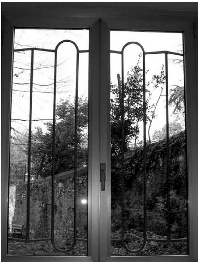
14. Građevinski fakultet Rijeka, Viktora Cara Emina 5, Rijeka, sačuvane prozorske rešetke