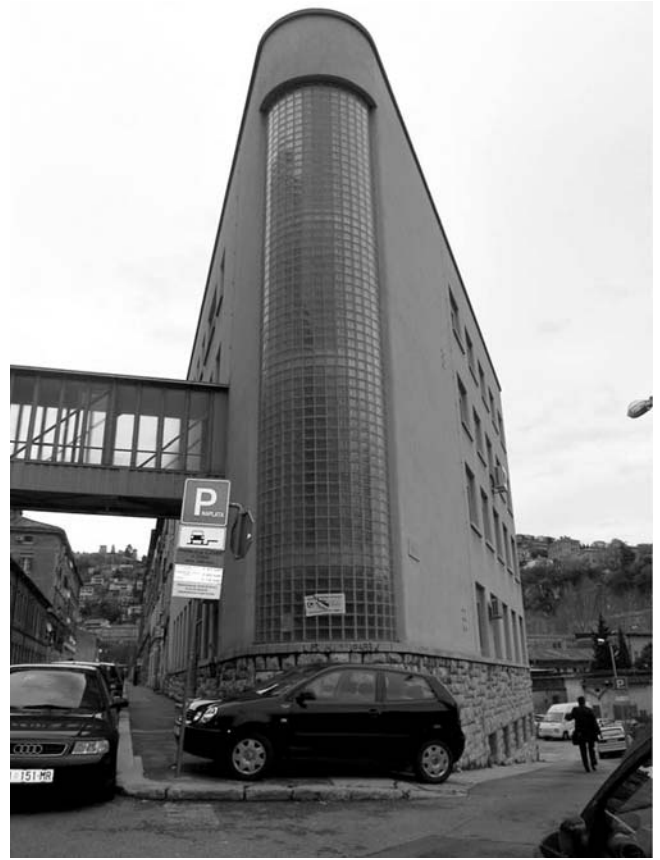
9. Državni arhiv Rijeka, Vodovodna ulica 2, Rijeka, stanje poslije adaptacije