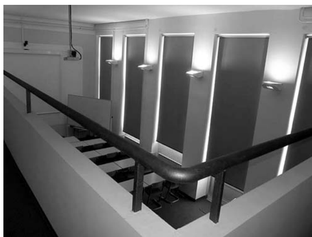
17. Građevinski fakultet Rijeka, Viktora Cara Emina 5, Rijeka, prostor adaptirane projekcijske sale u prizemlju