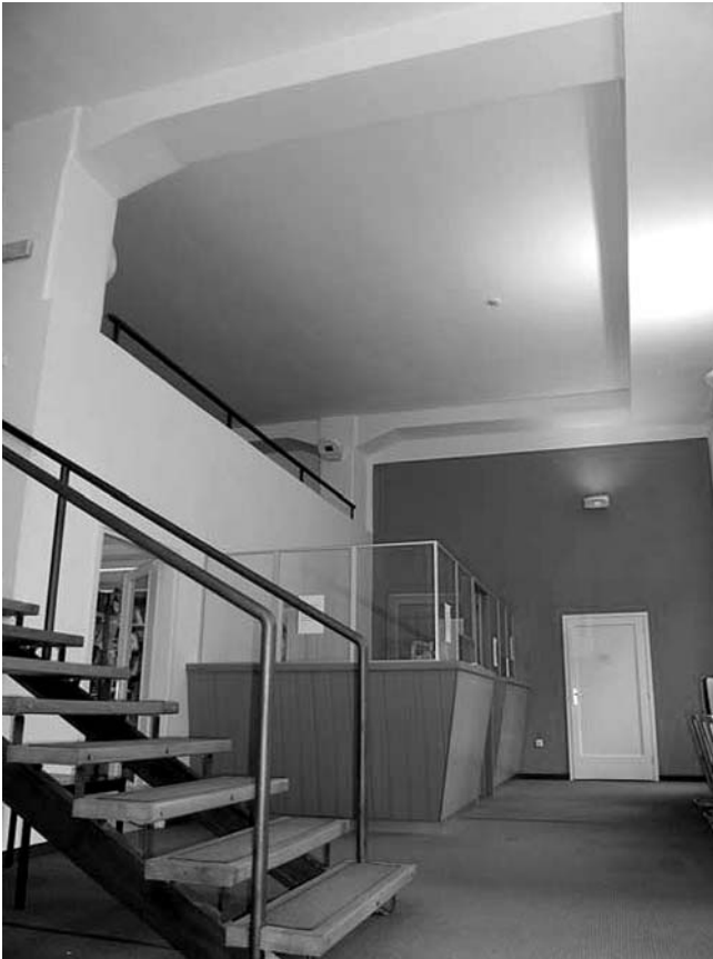
16. Građevinski fakultet Rijeka, Viktora Cara Emina 5, Rijeka, prostor adaptirane biblioteke u prizemlju