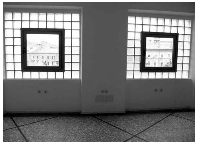
12. Državni arhiv Rijeka, Vodovodna ulica 2, Rijeka, aluminijska prozorska bravarija, sačuvani podni taraco