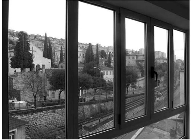
5. Hotel Neboder, Strossmayerova ulica 1, Rijeka, peterokrilni prozor stepeništa (aluminijska bravarija)