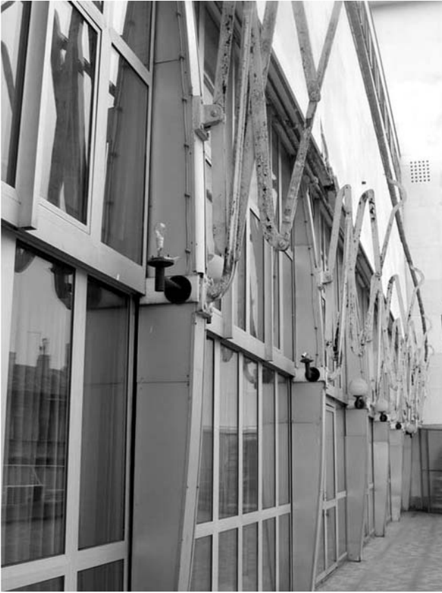
8. Hotel Neboder, Strossmayerova ulica 1, Rijeka, sačuvani držač tende