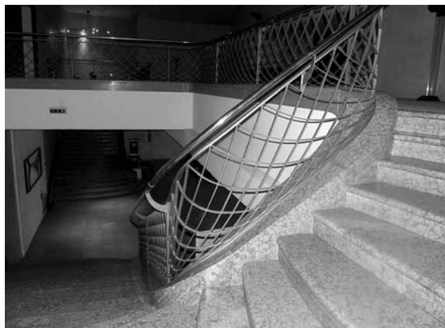
3. Hrvatski kulturni dom, Strossmayerova ulica 1, Rijeka, stepenište s ogradom od almasimuma