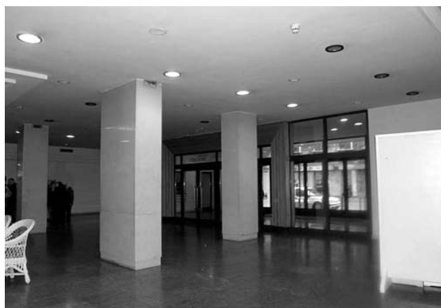
2. Hrvatski kulturni dom, Strossmayerova ulica 1, Rijeka, adaptirani foaje