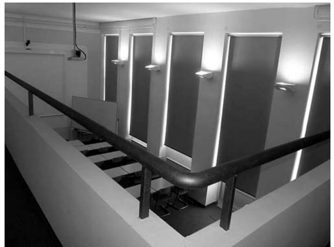
17. Građevinski fakultet Rijeka, Viktora Cara Emina 5, Rijeka, prostor adaptirane projekcijske sale u prizemlju