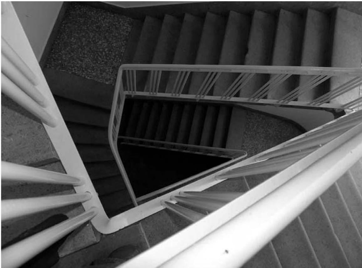
10. Državni arhiv Rijeka, Vodovodna ulica 2, Rijeka, detalji stepeništa