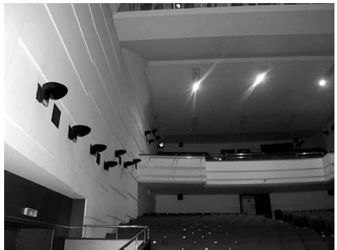
7. Hrvatski kulturni dom, Strossmayerova ulica 1, Rijeka, velika dvorana