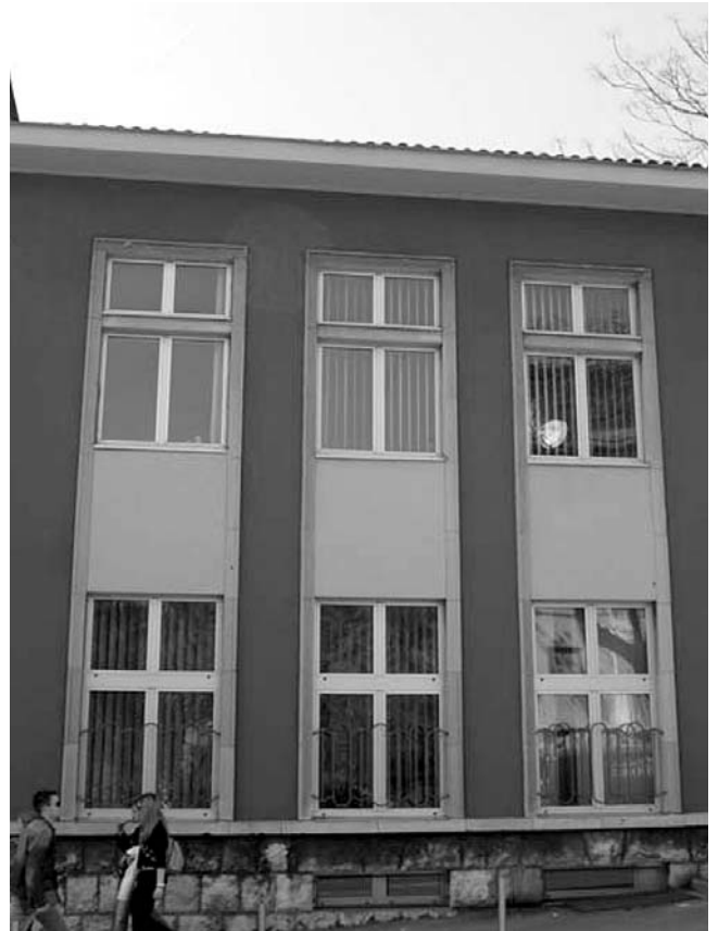
11. Državni arhiv Rijeka, Vodovodna ulica 2, Rijeka, ojačana konstrukcija stropova