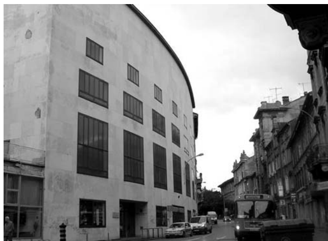
1. Hrvatski kulturni dom, Strossmayerova ulica 1, Rijeka, nova prozorska bravarija