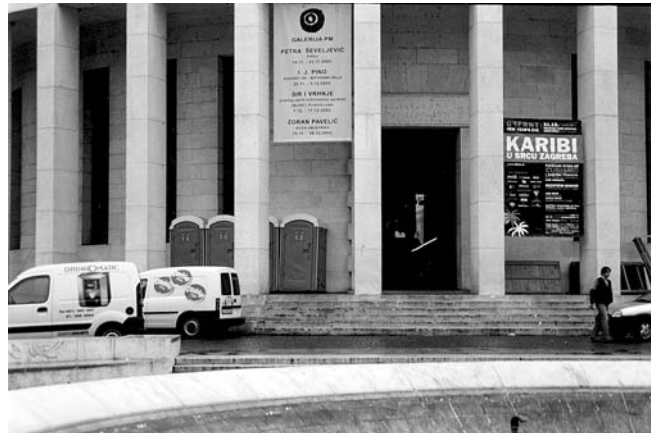
8. SRETNA NOVA 2004! U trijemu spomenika kulture nije umjetnička instalacija već nadomjestak za nepostojanje prateće infrastrukture neophodne kod iznajmljivanja prostora.