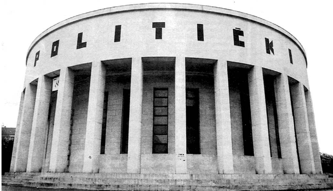
9. Zoran Pavelić »POLITIČKI GOVOR JE SUPREMATIZAM«, 1999.