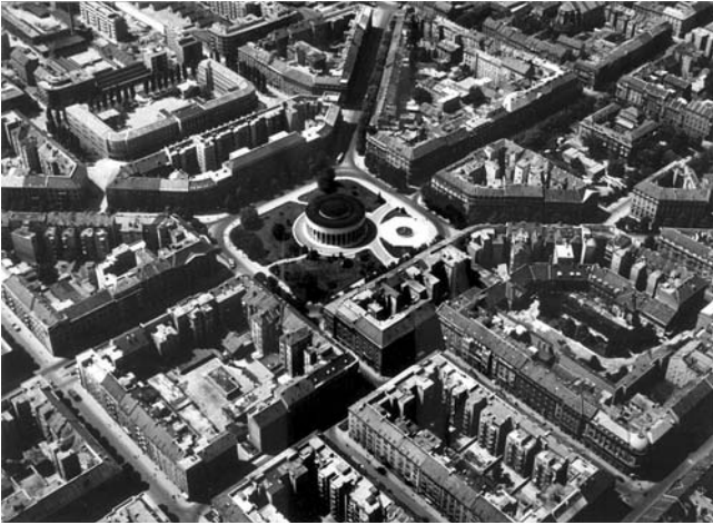
1. Meštrovićev paviljon, Snimka iz zraka, oko 1958.-59.