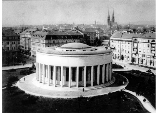
2. Moderna rotonda. Oko 1938.-39. (Muzej grada Zagreba)