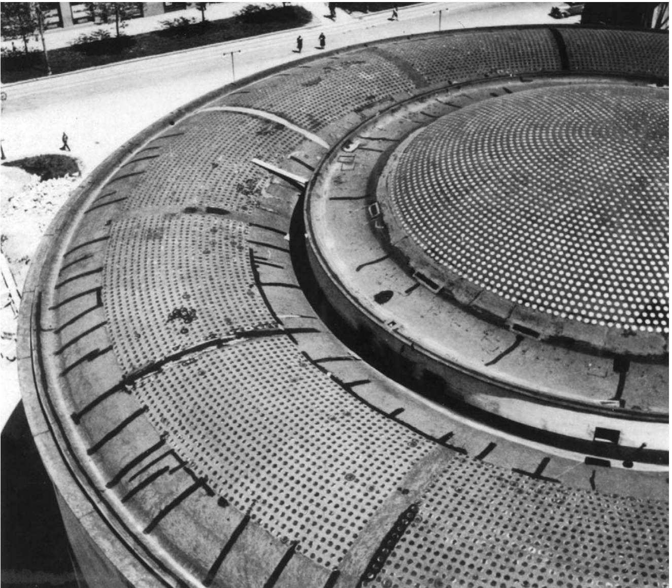
4. Plitka kupola središnje dvorane i svod prstenaste dvorane od armiranog betona i stakla. (Muzej grada Zagreba)