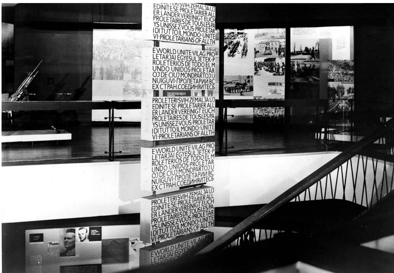
7. Arh. Vjenceslav Richter radio je izložbeni postav Muzeja revolucije naroda Hrvatske u radikalno »apastraktnom« stilu, 1952. Muzej revolucije naroda Hrvatske (Hrvatski povijesni muzej)