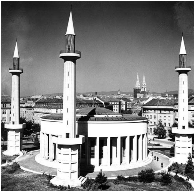
6. Dom likovnih umjetnosti pregrađen je 1941. u džamiju (adaptacija interijera arh. Z. Požgaj, adaptacija eksterijera arh. Stjepan Planić)