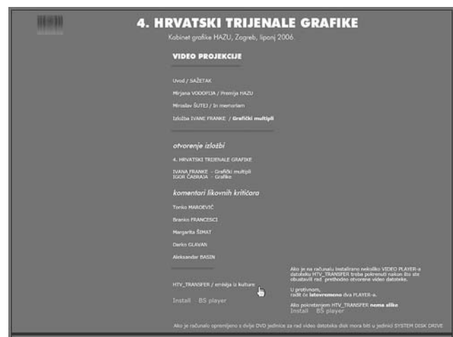
Četvrti hrvatski trijenale grafike, multimedijski interaktivni CD, Kabinet grafike HAZU