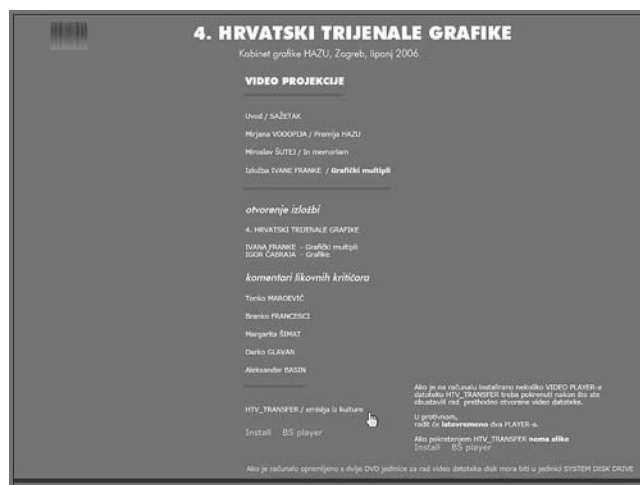
Četvrti hrvatski trijenale grafike, multimedijski interaktivni CD, Kabinet grafike HAZU