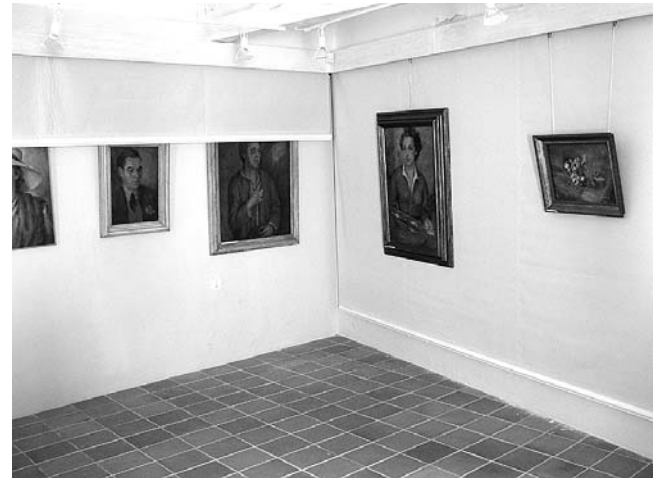
10. Višenamjenski prostor Galerije »Cate Dujšin – Ribar«, pomična rolo-platna.