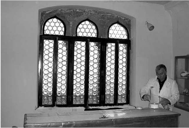
7. Obnovljena stakla gotičke trifore na zapadnom zidu starije palače Garagnin-Fanfogna (fotografija je napravljena pri završetku radova).