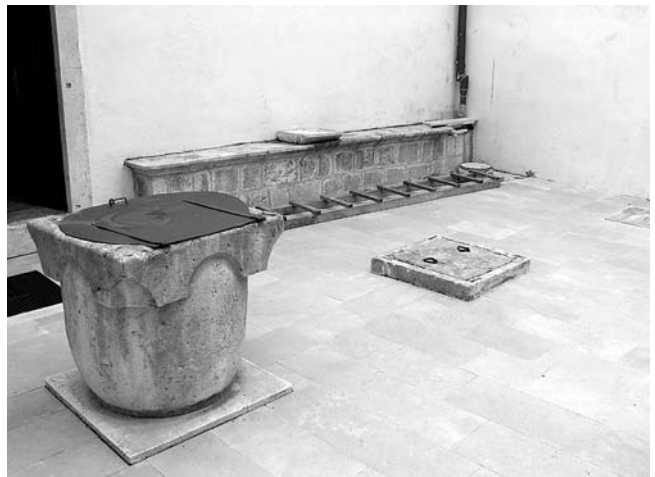
6. Cisterna palače Garagnin Fanfogna pri kraju obnove.