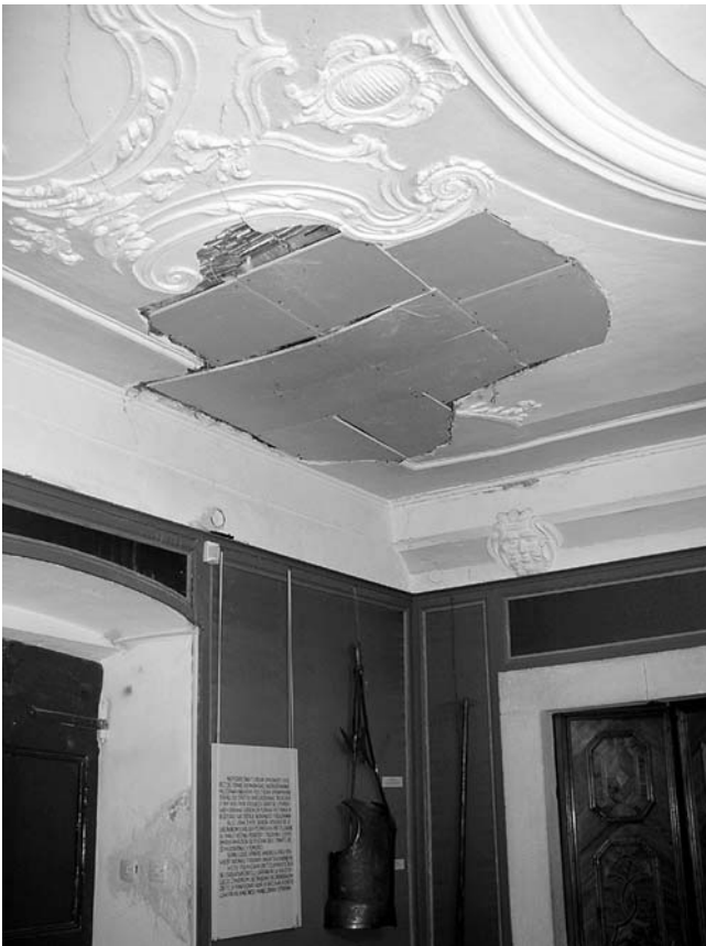
8. Oštećenja na stropu u stalnom postavu Muzeja grada Trogira, nakon izrezivanja stropa prije završene zaštitne sanacije.