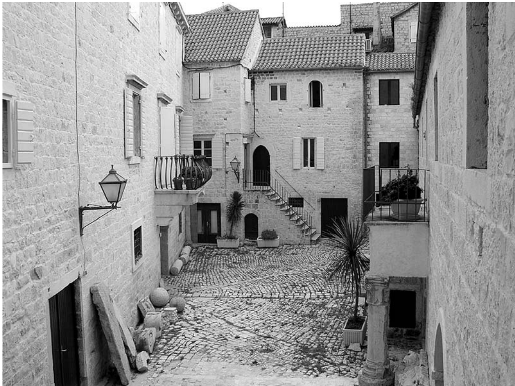
2. Dvorište palače Garagnin – Fanfogna/Muzej grada Trogira.