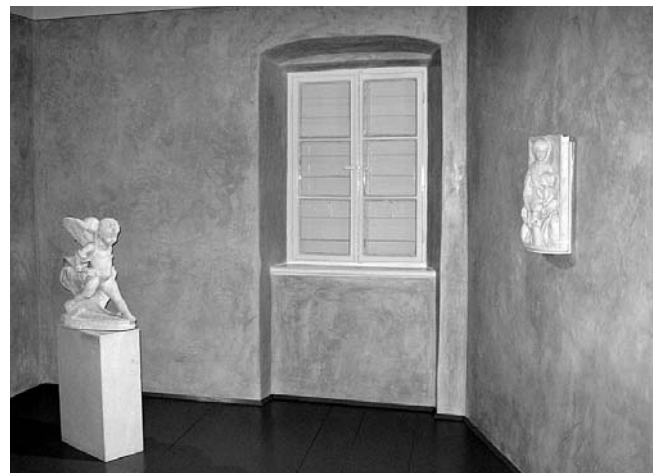
11. Novi postav djela Ivana Duknovića (Bogorodica s djetetom, Putto grbonoša obitelji Cipiko) u Muzeju grada Trogira.