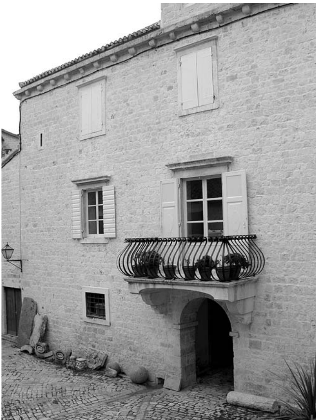
5. Južno pročelje obnovljenog dijela palače Garagnin-Fanfogna.