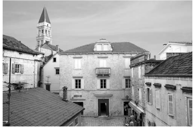
9. Muzej grada Trogira, sjeverno pročelje nakon obnove, ulaz u dvorišni dio.