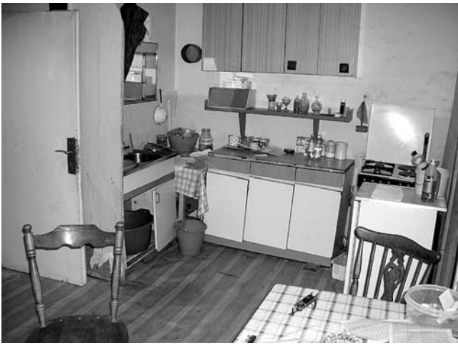
3. Prostori koji su služili kao stanovi u palači Garagnin-Fanfogna.