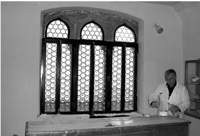
7. Obnovljena stakla gotičke trifore na zapadnom zidu starije palače Garagnin-Fanfogna (fotografija je napravljena pri završetku radova).