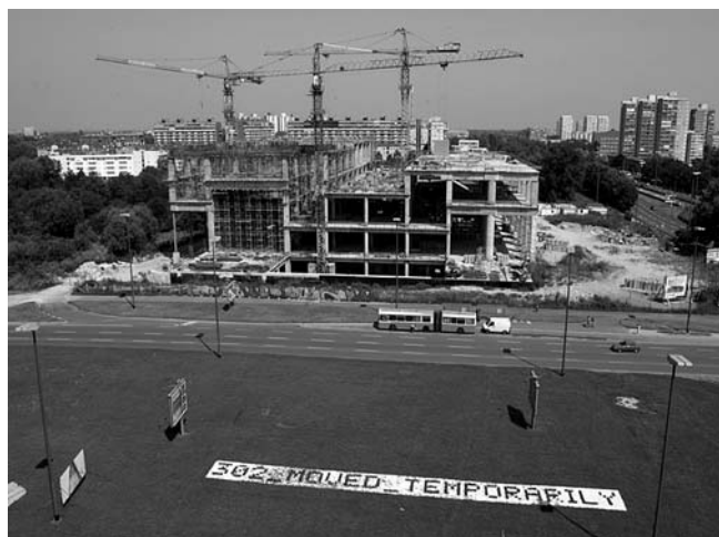
Muzej suvremene umjetnosti u gradnji, 2006.