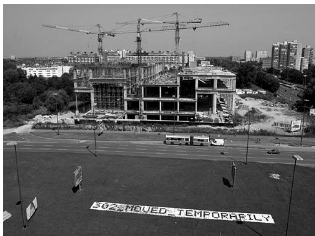
Muzej suvremene umjetnosti u gradnji, 2006.