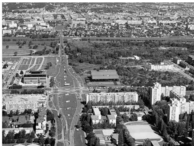
Muzej suvremene umjetnosti u gradnji, 2006.