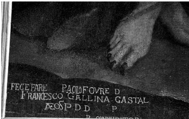
5. Kopar, Crkva Sv. Nikole, Vrag u liku žene nudi hodočasticima ulje što gori u vodi i na kamenju (detalj), Majstor funtanske pale i radionica (?), 1620. (?)