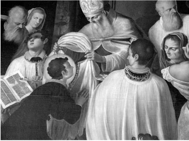
3. Kopar, Crkva Sv. Nikole, Običavanje sv. Nikole (detalj), Majstor funtanske pale i radionica (?), 1620. (?)