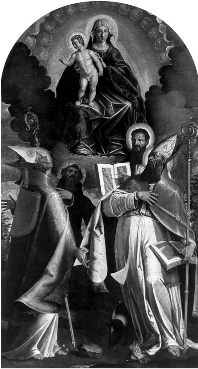
1. Funtana, Župna crkva Sv. Bernarda, oltarna pala Bogorodica s Djetetom, sv. Nikolom, Franjom Asiškim, Bernardom i Antunom Opatom , Majstor funtanske pale, 1621. ili početak 1622. godine