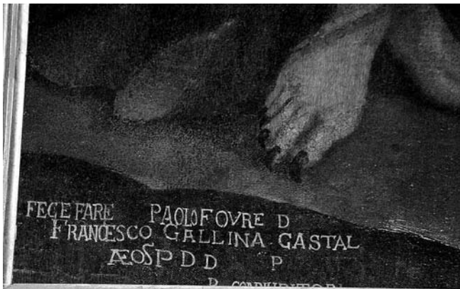
5. Kopar, Crkva Sv. Nikole, Vrag u liku žene nudi hodočasnici ulje što gori u vodi i na kamenju (detalj), Majstor funtanske pale i radionica (?), 1620. (?)