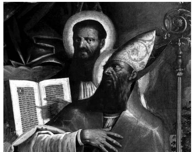
2. Funtana, Župna crkva Sv. Bernarda, oltarna pala Bogorodica s Djetetom, sv. Nikolom, Franjom Asiškim, Bernardom i Antunom Opatom (detalj), Majstor funtanske pale, 1621. ili početak 1622. godine