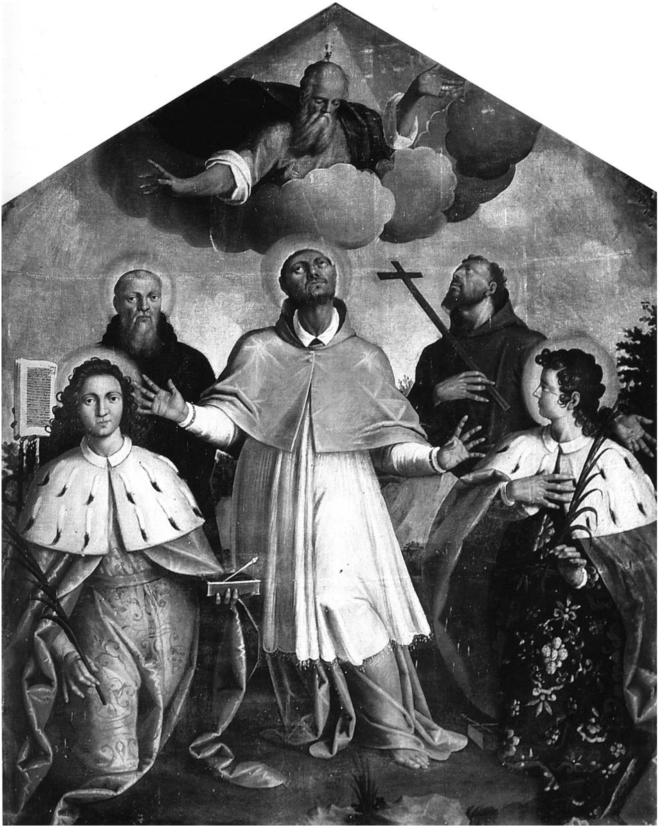
6. Buzet, Župna crkva Uznesenja Marijina, oltarna pala Bog Otac sa sv. Kuzmom, Franjom Asiškim, Karlom Boromejskim, Benediktom i Damjanom , Majstor funtanske pale, treće desetljeće 17. stoljeća