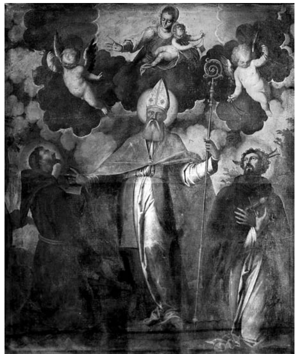
7. Buzet, Zavičajni muzej, oltarna pala Bogorodica s Djetetom, sv. Franjom Asiškim, sv. Niceforom i sv. Petrom mučnikom , Majstor funtanske pale i radionica (?), oko 1634. godine