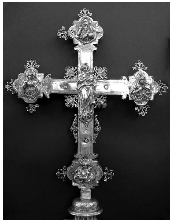
8. Korčula, dvorana bratovštine Blažene Djevice Marije od Utjehe – Pojasa, procesionalno raspelo, revers