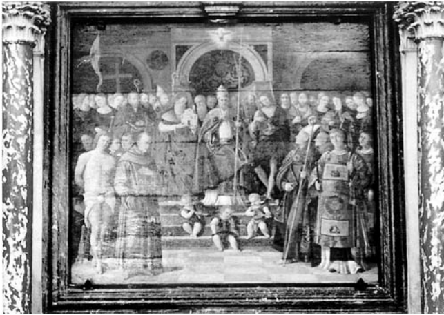
Oltarna pala Svih Svetih u župnoj crkvi u Blatu