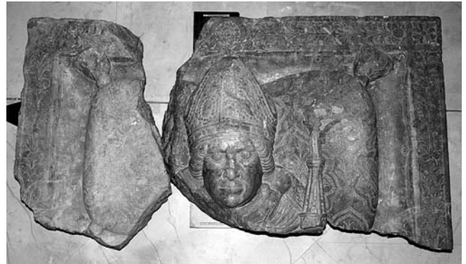
Nadgrobna ploča biskupa Luke (Hrvatski povijesni muzej, Zagreb)