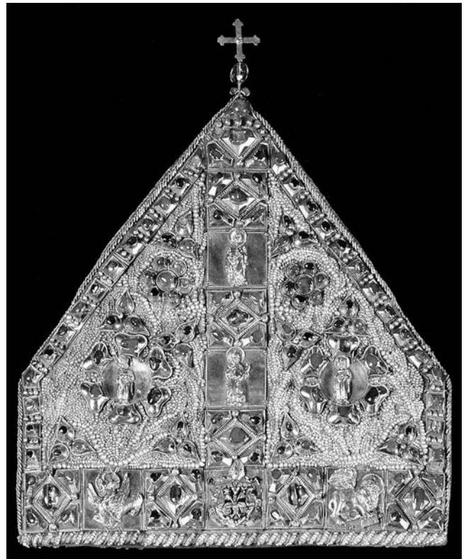
Mitra biskupa Tusza (Riznica zagrebačke katedrale)