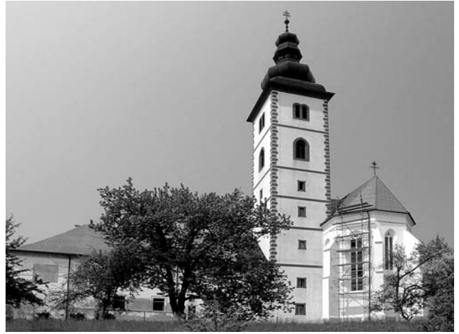
Crkva Sv. Ivana Krstitelja