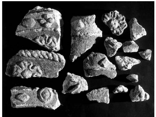
Kameni ulomci iz Kloštar Ivanića (Hrvatski povijesni muzej, Zagreb)