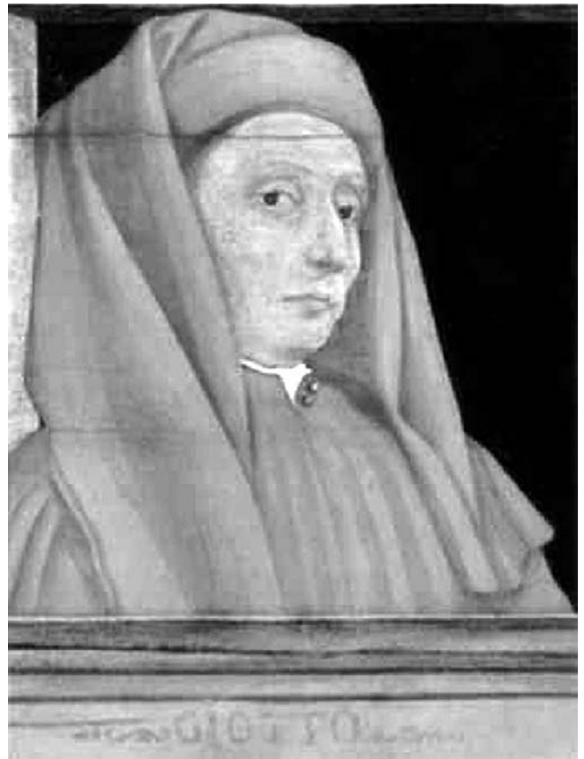
Paolo Ucello, Portret Giotta

On the eastern façade of the lighthouse constructed in 1871 at Jadrija near Šibenik, there is an in-built stone head – a life-size portrait. The author has attributed it to Juraj Dalmatinac, portrait sculptor from the early Renaissance period and author of the frieze consisting of 71 human heads at the Šibenik cathedral. This portrait belongs to the series of individualized portraits of the »common man« made by Juraj Dalmatinac. The portrait has been analysed and compared with his other psychological portraits, characterized by particular types of faces, hats, or hairstyles. In the mid-19 th century, 14 heads were substituted by new ones. On the southern apse, which bears 15 heads, the eighth head was substituted (counting from the left or from the south), which has now been associated with the portrait attributed to Juraj Dalmatinac.