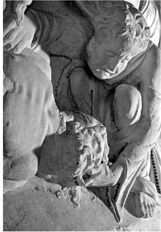
Detalj reljefa s prikazom Oplakivanja s glavom Krista (crkva Sv. Ivana Krstitelja u Trogiru)