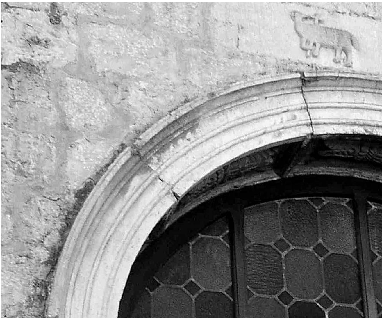
Prozor na crkvi Sv. Nikole u Trogiru