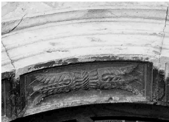
Kaseta na luku prozora na crkvi Sv. Nikole