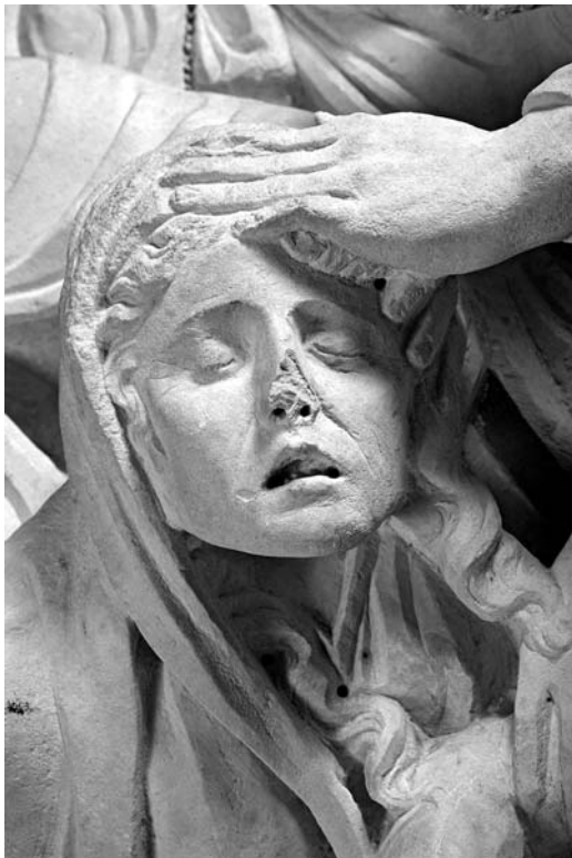
Detalj reljefa s prikazom Oplakivanja s glavom Bogorodice (crkva Sv. Ivana Krstitelja u Trogiru)