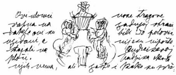
Crtež Roka Slade-Šilovića s prikazom anđela nađenih u grobu u crkvi Sv. Ivana Krstitelja u Trogiru