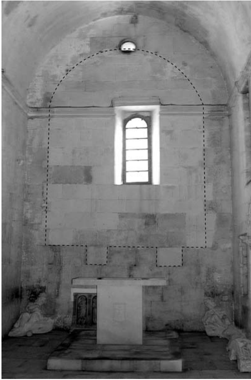
Apsida crkve Sv. Ivana Krstitelja u Trogiru s pokušajem rekonstrukcije obrisa nadgrobnog spomenika