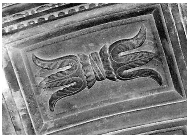
Kaseta na luku grobnice Sobota u crkvi Sv. Dominika u Trogiru