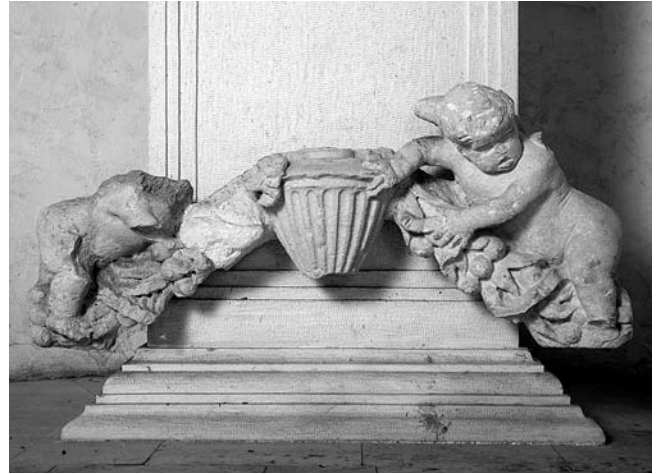
Anđeli na girlandi položeni naknadno na stepeništu novog postamenta za kip u crkvi Sv. Sebastijana u Trogiru