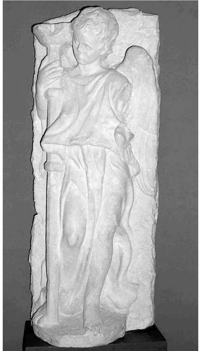
Anđeo bakljonoša (Lapidarij u sklopu Muzeja grada Trogira)