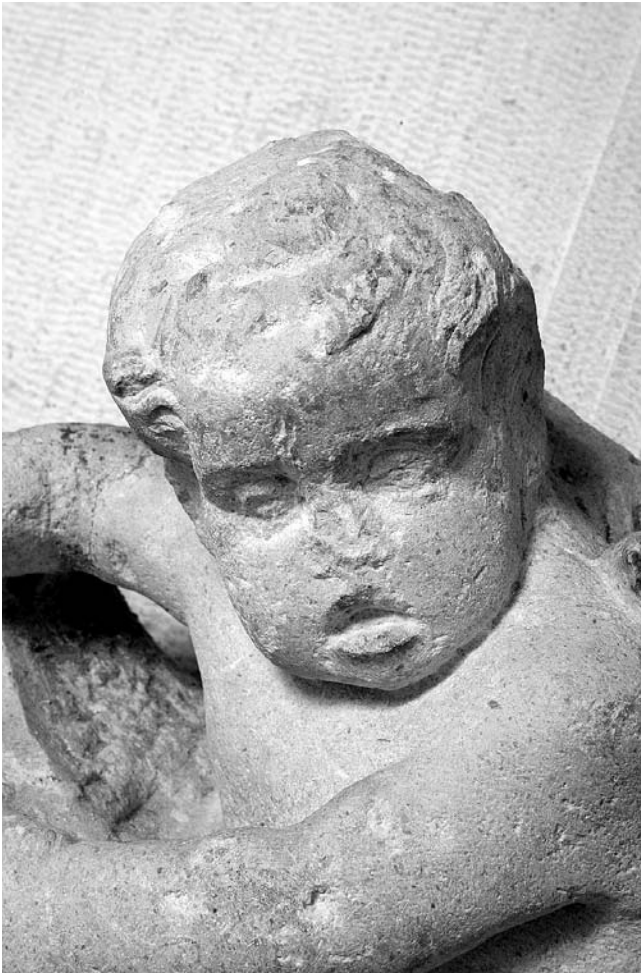
Glava anđela s girlande