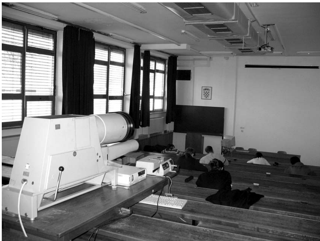
Sukob ili suživot starog i novog: muzejski primjerak episkopa i dia projektor uz koje je tipkovnica za elektronsko reproduciranje preko projektora postavljenog na stropu dvorane.