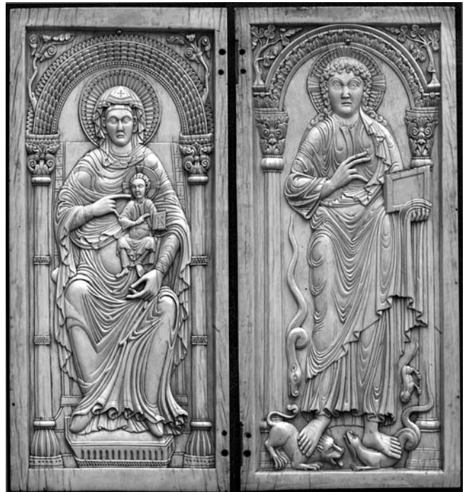
3. Bjelokosni diptih, 10./11. stoljeće (?), Strossmayerova galerija starih majstora, Zagreb