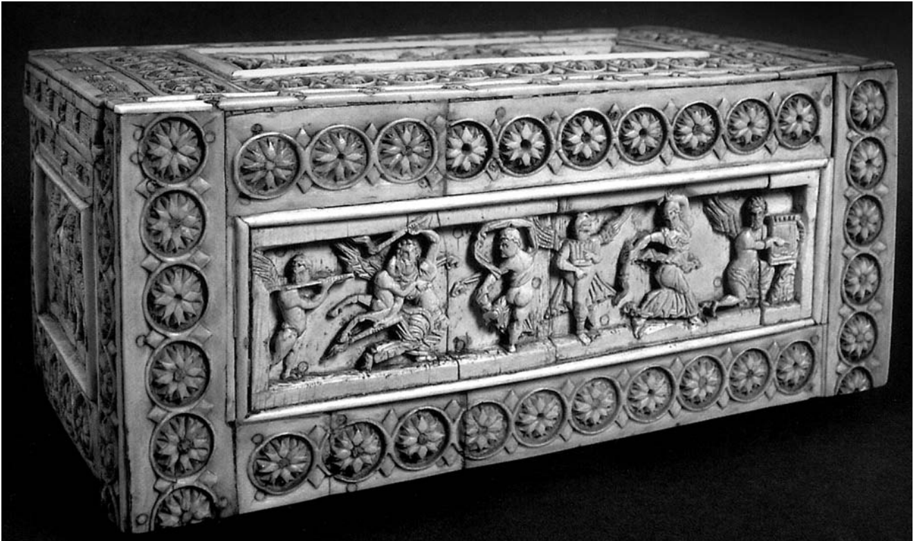
1. Bjelokosna škrinjica, 10. stoljeće, Arheološki muzej, Pula