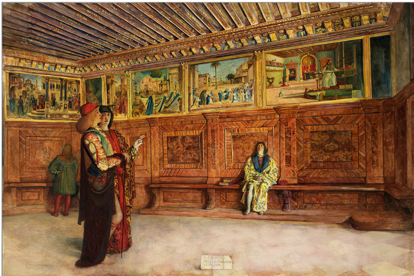
Joseph Lindon Smith, Kritičari: San Giorgio degli Schiavoni, Venecija, 1894. akvarel, 76,2 × 116,2 cm, Boston, Museum of Fine Arts