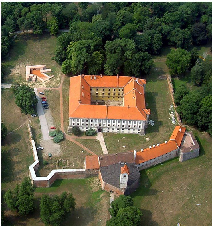
Slika 1 Čakovečki Stari grad s palačom i okolnom fortifikacijom

Čakovečki Stari grad novovjekovni je kompleks koji se sastoji od četverokrilne palače s unutrašnjim dvorištem okružene fortifikacijskim sustavom zidina i bastiona (sl. 1). U palači, u kojoj je danas smješten Muzej Međimurja, tijekom povijesti prebivalo je nekoliko plemićkih obitelji, od kojih je za međimursku, ali i hrvatsku povijest najvažnija obitelj Zrinski. Od 1546. do 1691. Čakovec je bio sjedište pet naraštaja te velikaške