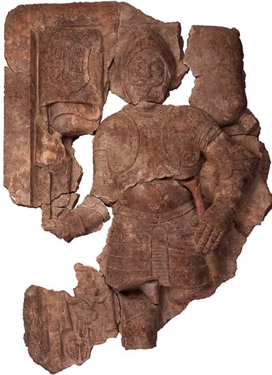
Slika 2 Nadgrobna ploča Nikole IV. Zrinskoga (†1566.) (?) mramor, 162 × 115 × 22,5 cm, Čakovec, Muzej Međimurja Čakovec, inv. br. MMČ 11564