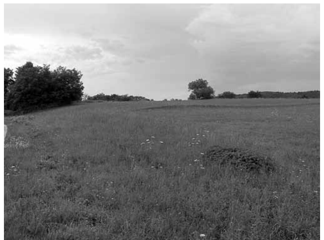
6. Poljangrad