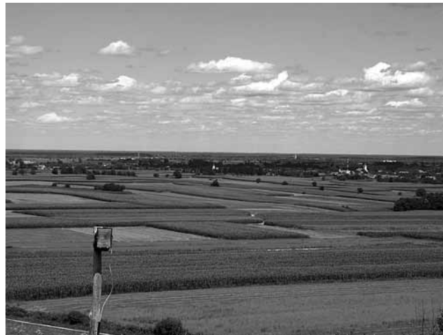
5. Pogled s Prkosa na Sv. Klaru