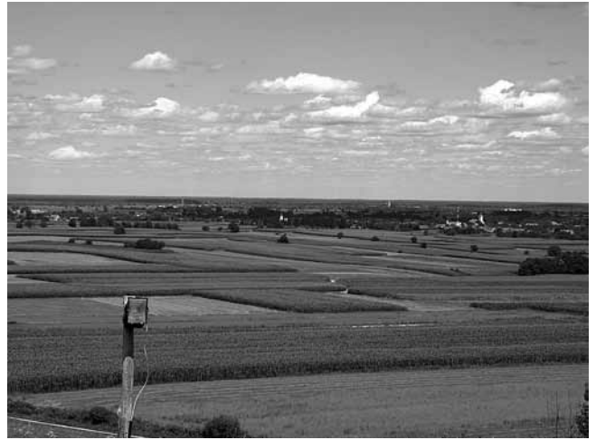
5. Pogled s Prkosa na Sv. Klaru