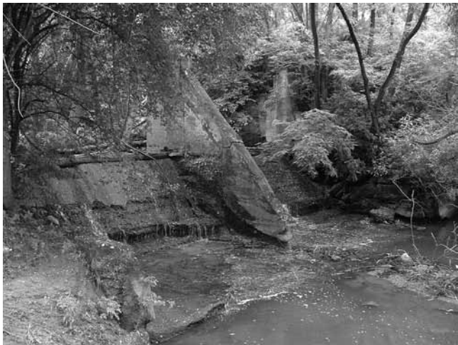
3. Pavetičev mlin