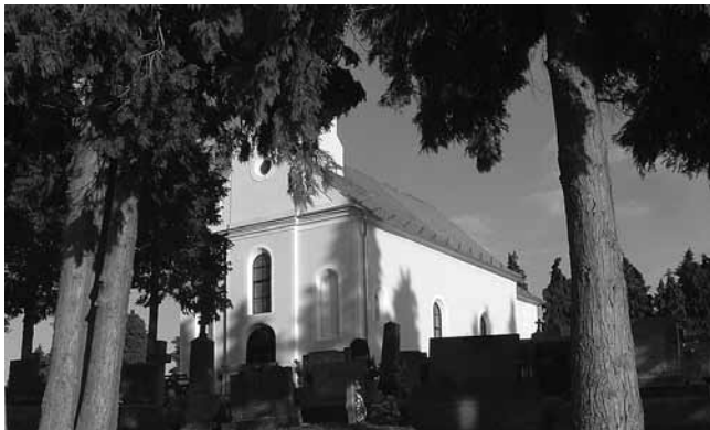
1. Kapela sv. Klare na groblju u Novigradu Podravskom