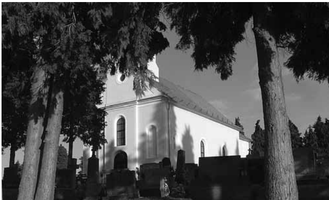
1. Kapela sv. Klare na groblju u Novigradu Podravskom