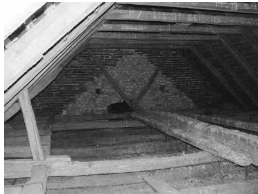
2. Kapela sv. Klare, krovništvo