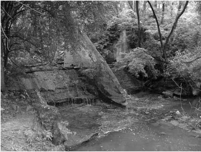
3. Pavetičev mlin