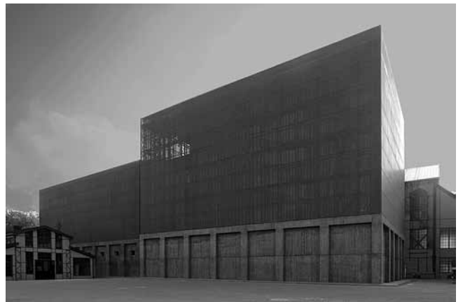
7. EMRE AROLAT arhitekti, Muzej suvremene umjetnosti Santralistanbul, Istanbul, 2006.