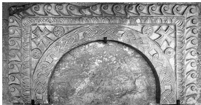
5. San Giorgio di Valpolicella, klaustar župne crkve, zabat oltarne pregrade (9. st.) nadopunjen i rekonstruiran kao stranica ciborija (izvor: Andrea Castagnetti, bilj. 6)