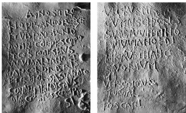
2. San Giorgio di Valpolicella, oltarni ciborij, natpisi iz 712. g. na prednjim stupovima (izvor: Andrea Castagnetti, bilj. 6)