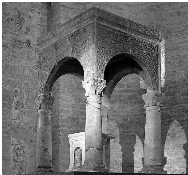
1. San Giorgio di Valpolicella, oltarni ciborij