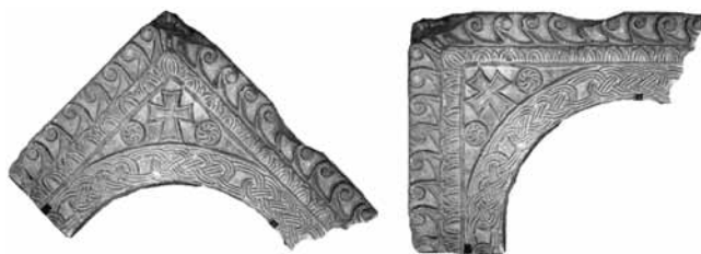
4. San Giorgio di Valpolicella, klaustar župne crkve, zabat oltarne pregrade (9. st.) u ispravnom i zarotiranom položaju