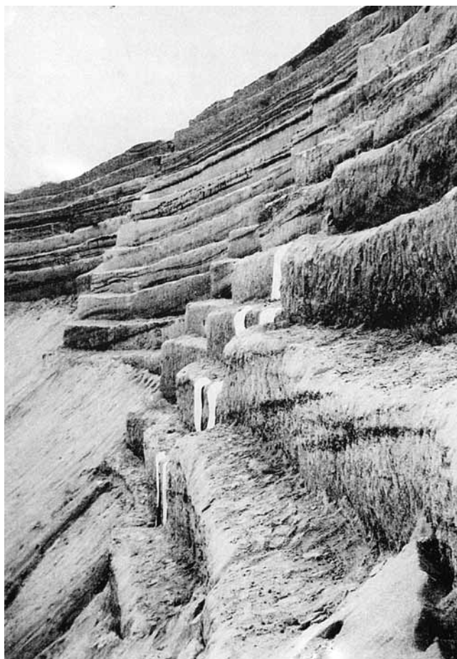
2. Pécsi Műhely, Károly Kismányoki i Kálmán Sijártó, Pješčara, Pečvar , 18. X. 1970.