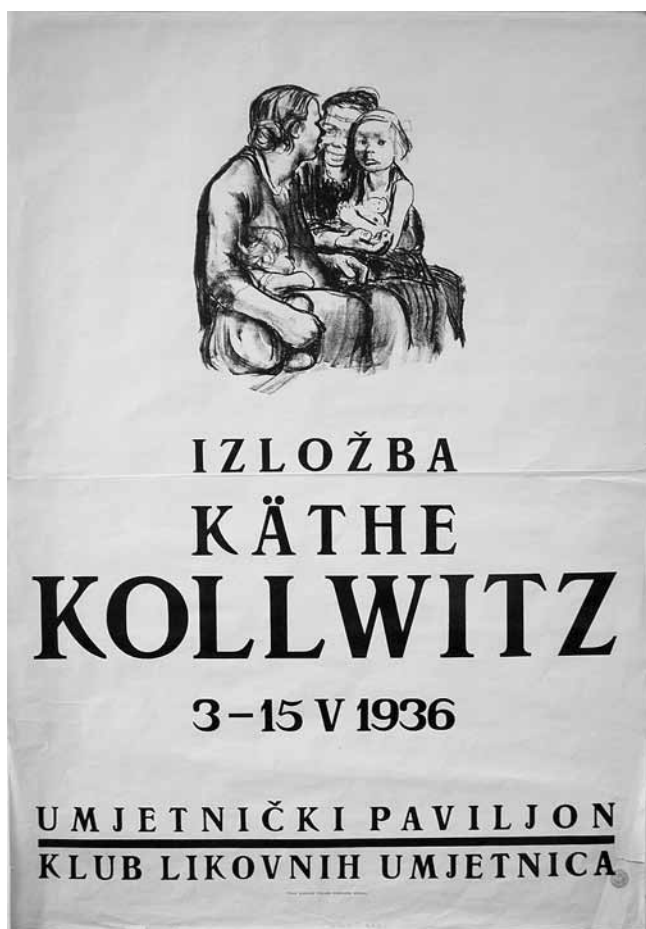
1. Vladimir Kirin, Plakat za izložbu Käthe Kollwitz, 1936., litografija (Kabinet grafike HAZU, Zagreb)