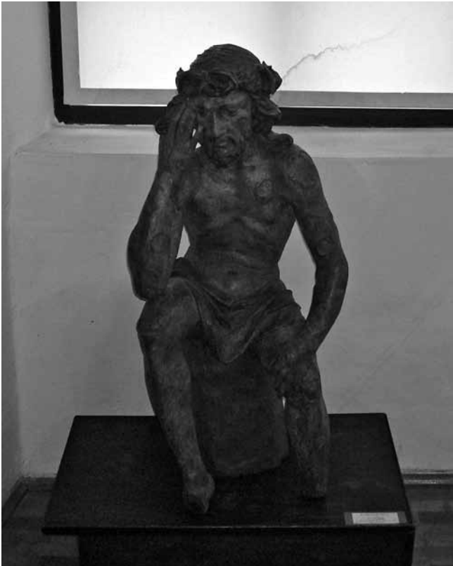
4. Križevci, Gradski muzej, Trpeći Krist ili Čovjek Boli (njem. Schmerzemann ), neznani kipar, oko 1700.