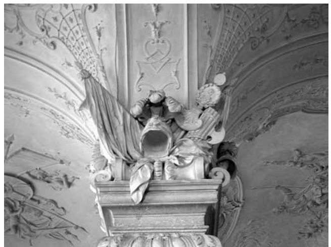
3. Motivi oružja u sala terrena , Gornji Belvedere, Beč