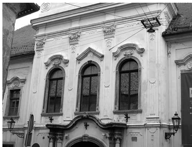
8. Pilastri središnjeg rizalita palače Vojković-Oršić-Rauch