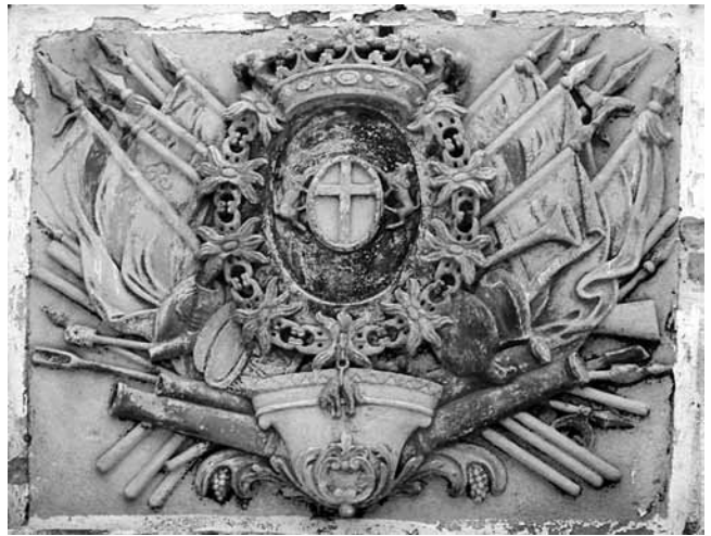
2. Grb Eugena Savojskog na dvorišnom pročelju