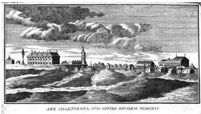
4. Arx Chaktornya cum oppido eiusdem nominis (crtež iz knjige J. Bedekovića, preuzeto iz: I. Srša, bilj. 16)