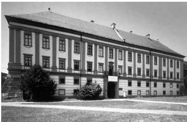
5. Palača Althan (Zrinjski), danas Muzej Međimurja, Čakovec