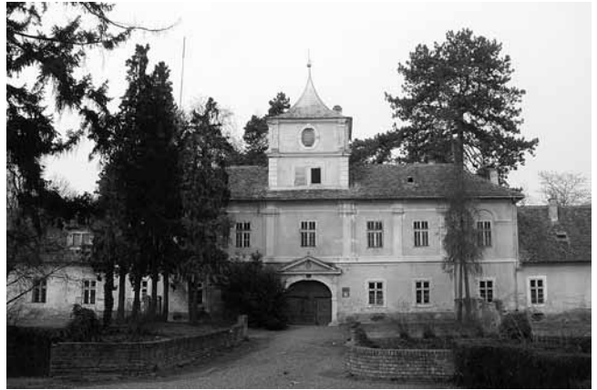
1. Dvorac Bilje, pročelje