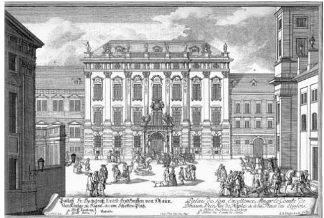
10. Salomon Kleiner, palača Daun-Kinsky (iz Wiener Veduten, preuzeto s http://commons.wikimedia.org/wiki/File:Daun-Kinsky_Salomon_Kleiner.jpg )