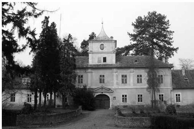
1. Dvorac Bilje, pročelje