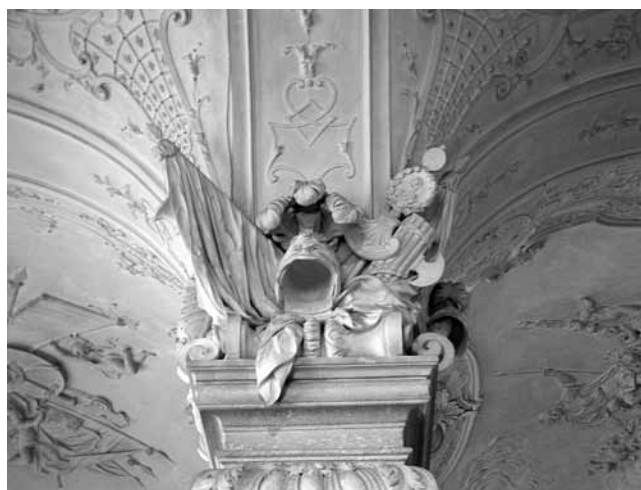
3. Motivi oružja u sala terrena , Gornji Belvedere, Beč