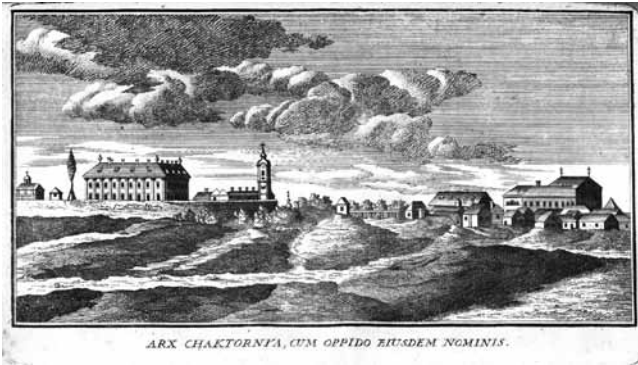
4. Arx Chaktornya cum oppido eiusdem nominis (crtež iz knjige J. Bedekovića, preuzeto iz: I. Srša, bilj. 16)