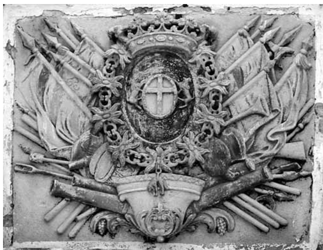
2. Grb Eugena Savojskog na dvorišnom pročelju