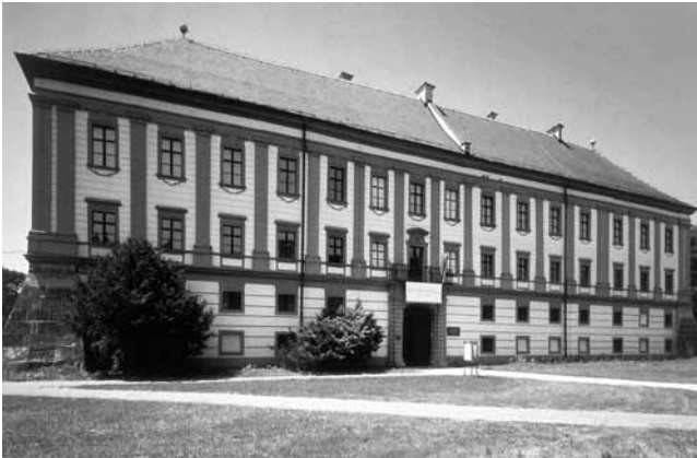
5. Palača Althan (Zrinjski), danas Muzej Međimurja, Čakovec