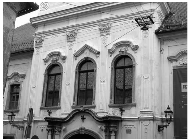
8. Pilastri središnjeg rizalita palače Vojković-Oršić-Rauch