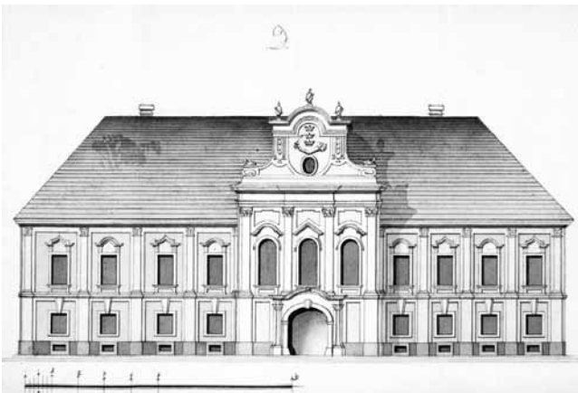
6. Crtež pročelja palače Vojković iz 1801. (preuzeto iz M. Bregovac Pisk, bilj. 24)