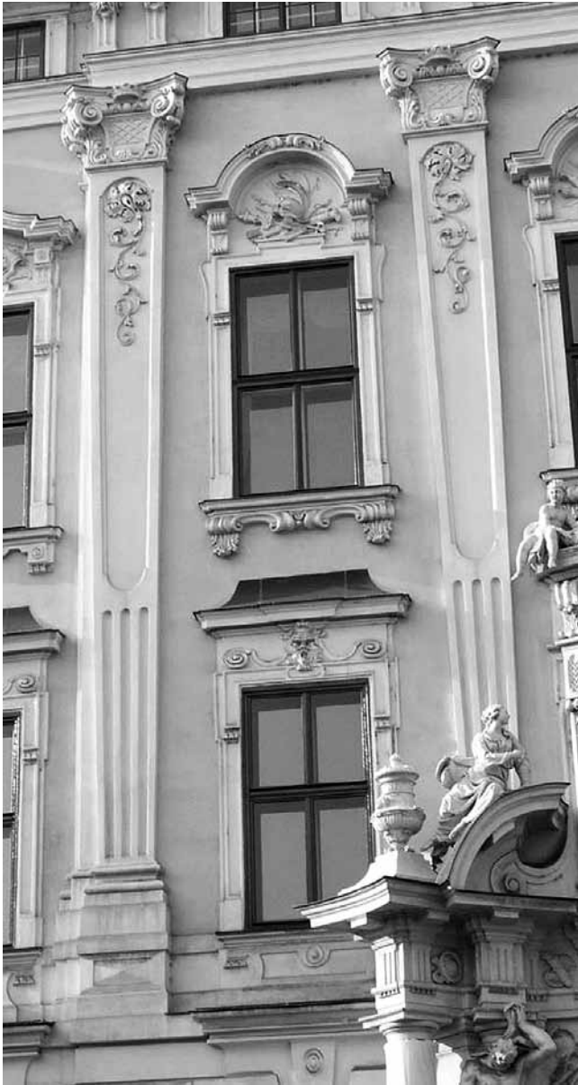
9. Pilastru na pročelju palače Daun-Kinsky, Beč