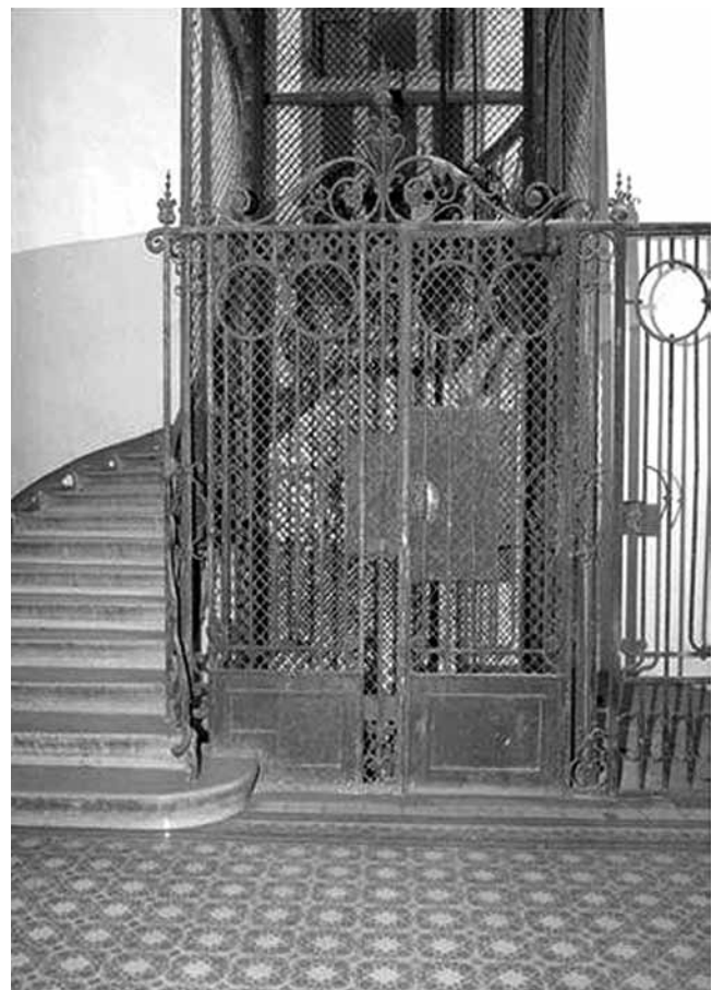
3. Najstarije sačuvano secesijsko dizalo marke Schindler u Rijeci, iz 1912. godine, Supilova ul. 13