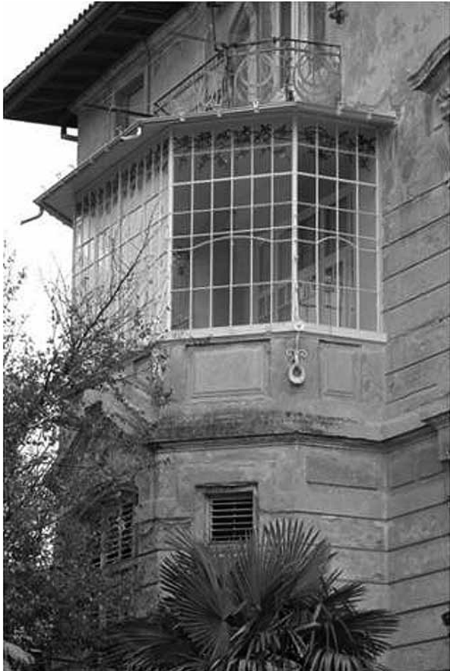
4. Restaurirani poligonalni erker vile Kramar u Ulici F. Prešerna 32 u Rijeci