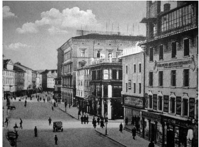
2. Kuća Schittar u Rijeci s ostakljenom atikom potkrovlja za smještaj fotoateljea; autor projekta adaptacije E. Ambrosini

Dobar primjer je Lombardija koja je članstvom u Réseau Art Nouveau Networku promovirala svoju Art Nouveau baštinu primjerenom njezinoj vrijednosti i zastupljenosti, budući da se po pitanju kulturnog naslijeđa u regiji favoriziraju ranija razdoblja, osobito renesansa i barok.