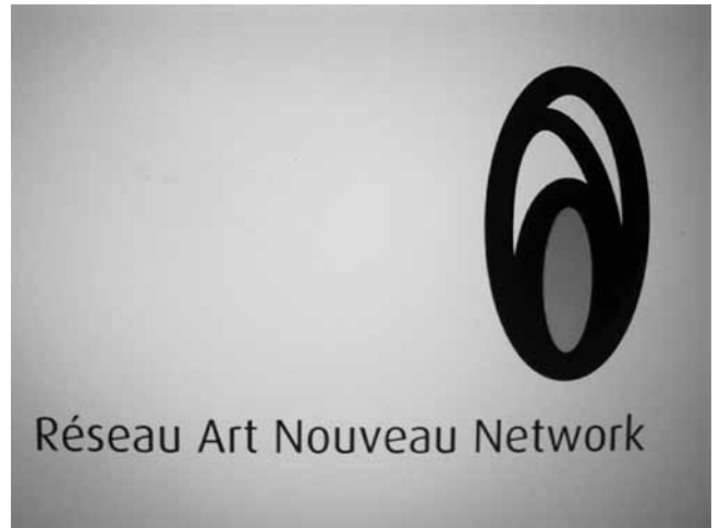
5. Logo mreže Réseau Art Nouveau Network