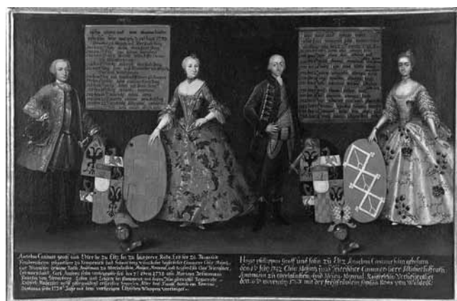
6. Georg Joseph Melber, Galerija predaka obitelji Eltz , posljednja četvrtina 18. stoljeća (Hrvatski povijesni muzej, Zagreb)