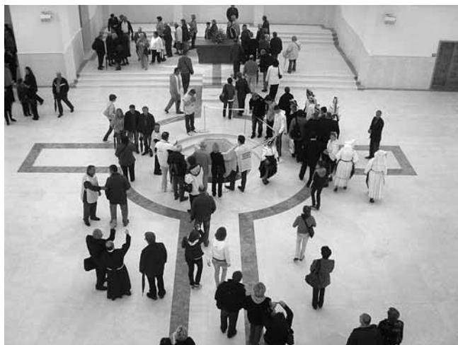
6. Udbina, pogled s pjevališta na glavni brod i gipsanu kopiju Višeslavove krstionice u sredini