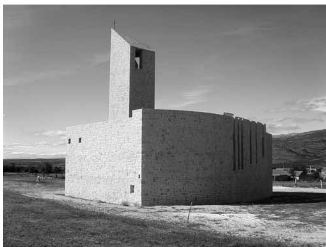
8. Čavoglave, crkva Hrvatskih mučenika