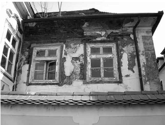
3. Zagreb, Znikina kurija, Kaptol 26, stanje u proljeće 2010.