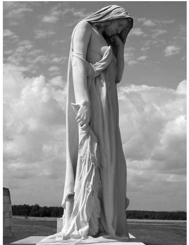
5. Prijedlog zadarskih branitelja za spomenik Domovinskom ratu