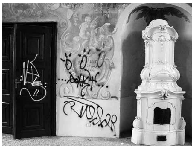
9. Dvorac Brezovica, unutrašnjost, grafiti