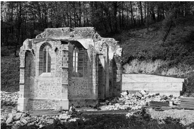
2. Zrin, crkva sv. Marije Magdalene, pogled sa sjeveroistoka nakon dovršetka radova u 2009. godini, nakon čega je prekinuto financiranje