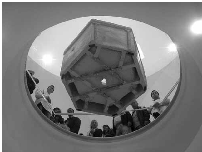
7. Udbina, pogled iz donjeg prostora namijenjenog za izložbe i različita okupljanja na gipsanu kopiju Višeslavove krstionice izloženu u crkvenom brodu