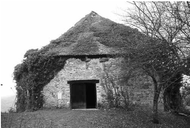
1. Veliki Tabor, baterijska kula, stanje prije štete od visokog snijega tijekom zime 2005./2006.