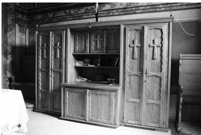
10. Belec, crkva sv. Marije Snježne, novi ormar u sakristiji koju je oslikao Ivan Ranger