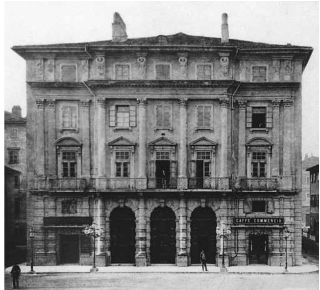
1. Teatro Adamich, 1803. – 1883.