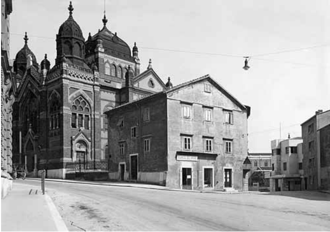
3. Lipot Baumhorn, Sinagoga, 1904. – 1944. (razglednica, priv. vl.)