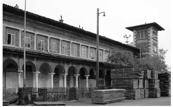
6. Sušački kolodvor na Brajdici, srušen 2008.