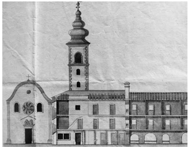
2. Sv. Rok, 1599. – 1911. (preslika iz R. Matejčić, Kako čitati grad , Rijeka, 2007.)