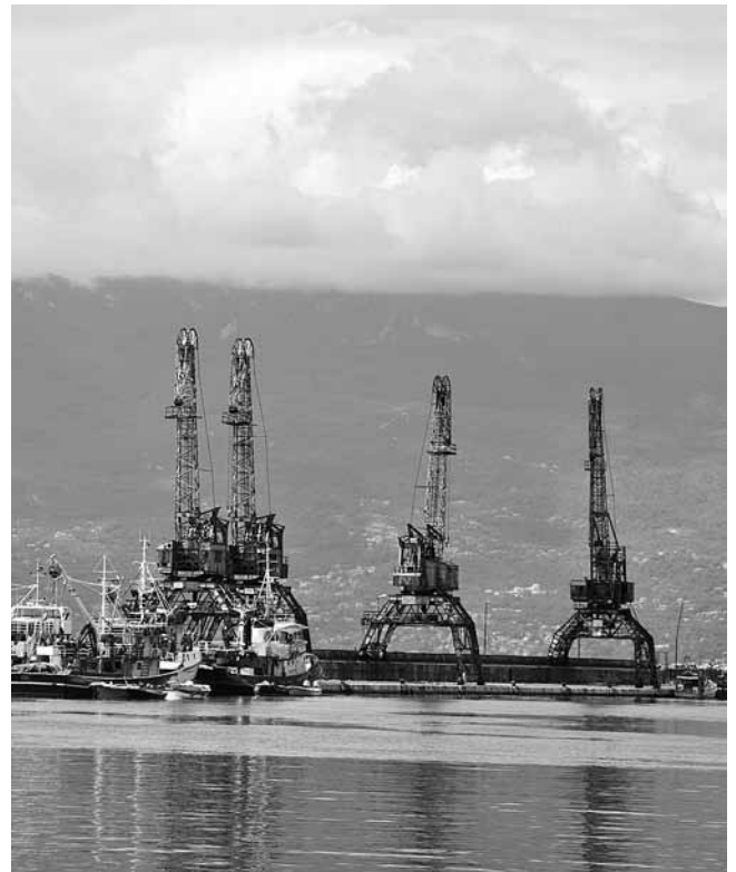
7. Lučke dizalice (snimio Ž. Stojanović)