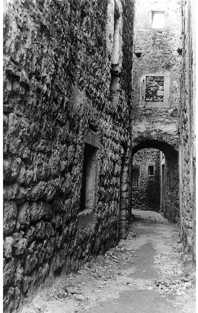
3. Vodice, Kinkležova ulica, prva polovina 20. st.