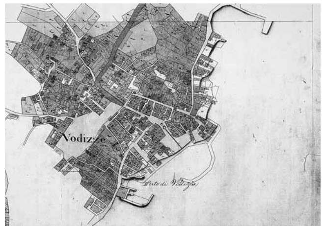
4. Katastarska karta, 1825. (DAS)