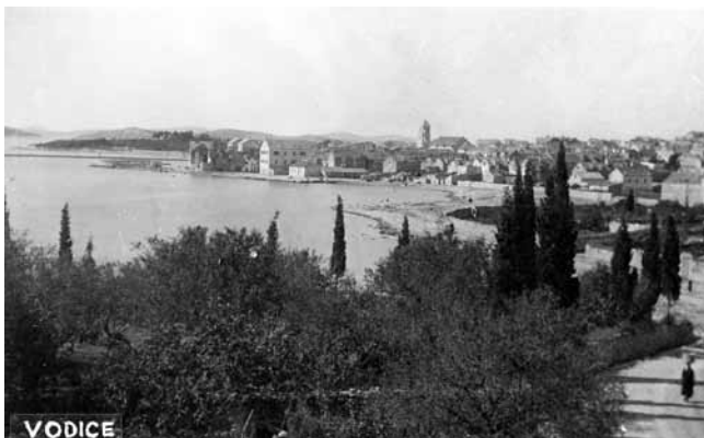
6. Vodice, pogled na naselje s istoka, 1930-ih