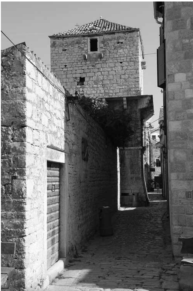
2. Vodička kula (»Čorićev turanj«), 1533.