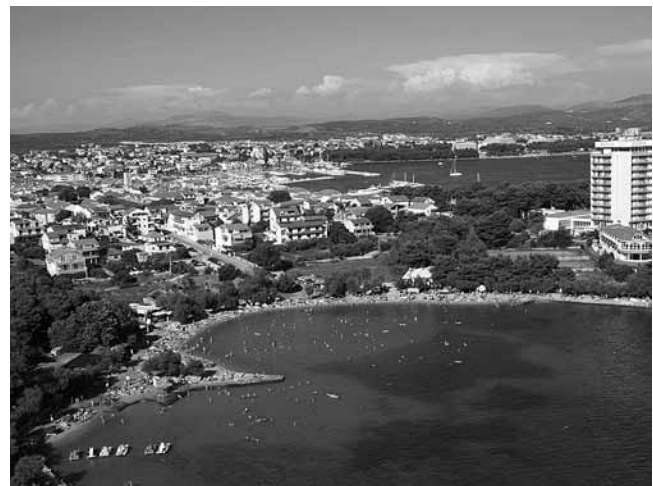
9. Vodice, pogled na naselje sa zapada