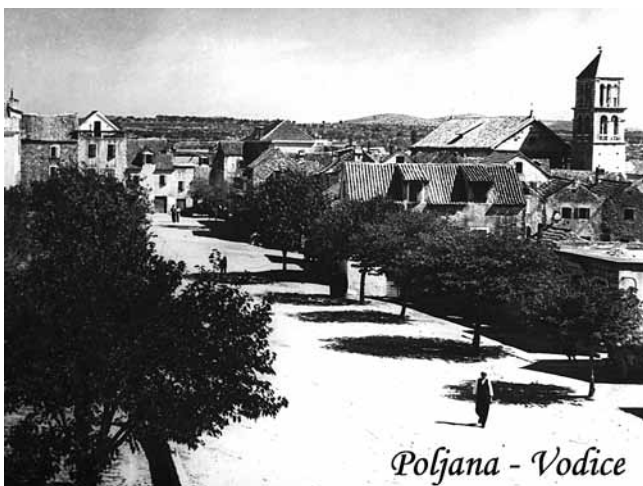
8. Poljana u Vodicama, 1930-ih (privatni arhiv I. Kranjca)