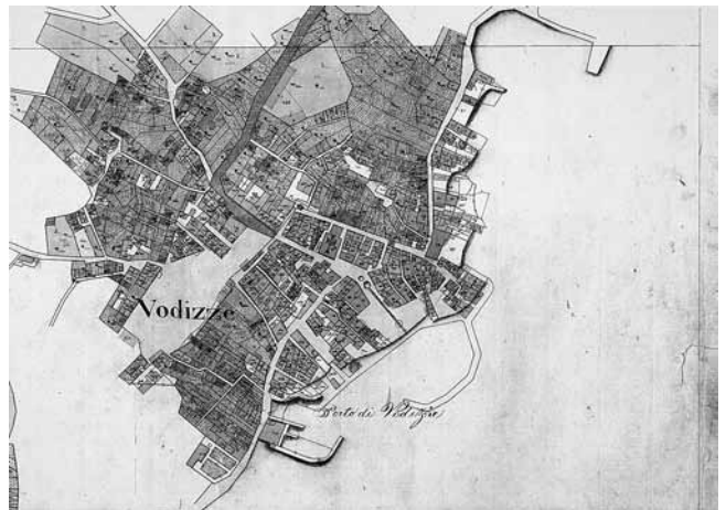
4. Katastarska karta, 1825. (DAS)