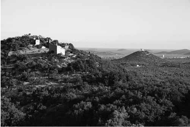
1. Vodice, pogled prema moru s kaštela Rakitnica