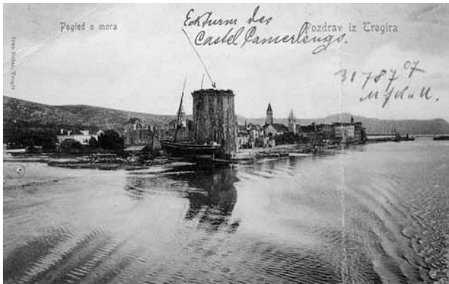
1. Trogir, kaštel Kamerlengo i zemljana obala (HDA)