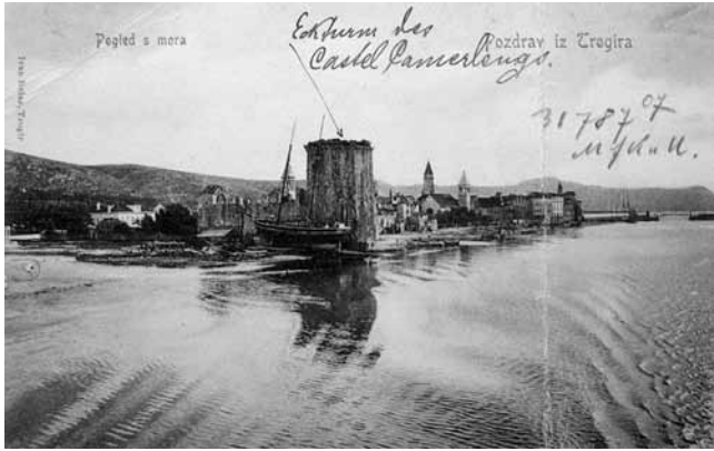
1. Trogir, kaštel Kamerlengo i zemljana obala