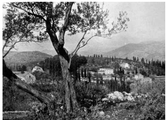
5. Vegetacija na Lapadu (MZK, IX treće serije, 1910.)