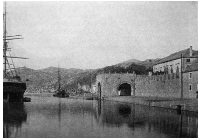
4. Ljetnikovac Gradić (MZK, VIII treće serije, 1909.)