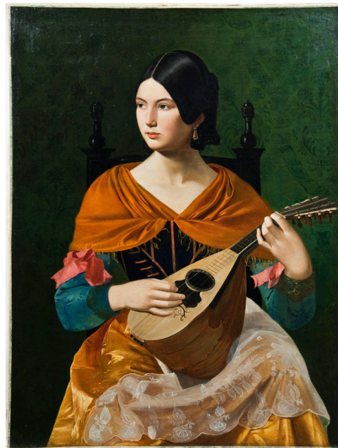
Slika 1 Vjekoslav Karas, Rimljanka s mandolinom , 1845.–1847. Hrvatski povijesni muzej, inv. br. HPM/PMH 8581