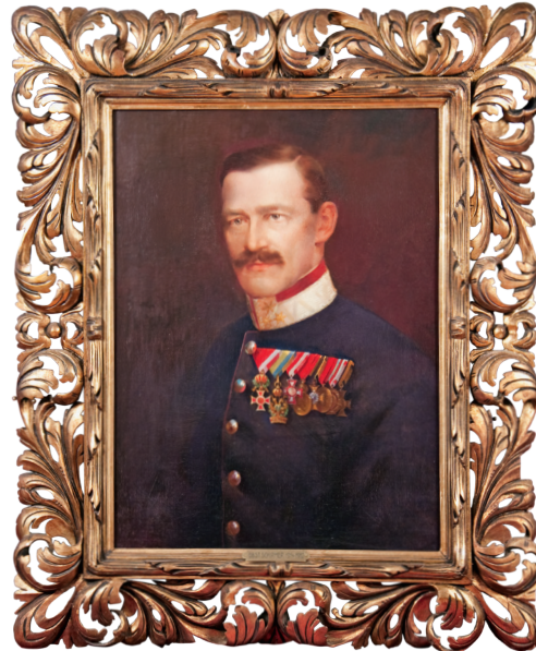
Slika 7 Ilustrovani list, br. 24, 12. lipnja 1915., str. 554 http://dnc.nsk.hr/DataServices/ ImageView.aspx?id=ec33e68c- d180-463d-850e-00a241f75a1a , 20.12.2016.