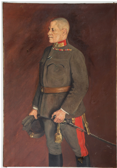
Slika 5 Adolf Rhemen zu Bärensfeld prema fotografiji iz dvorskog atelijera Antona Paula Hubera heliogravirano i otisnuto K.u.k. Militärgeographisches Institutu, izdao Rudolf Lechner, Beč, oko 1900. godine Hrvatski povijesni muzej, inv. br. 4533