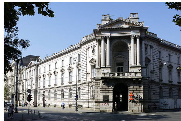
Slika 1 Sjedište Kabineta grafike HAZU