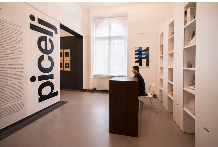
Slika 3 Izložbeni prostor Kabineta grafike HAZU