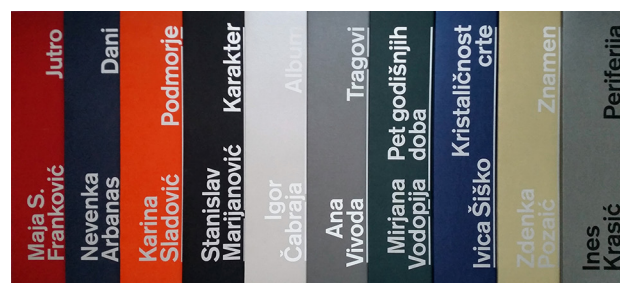
Slika 4 Izdanja Kabineta grafike HAZU