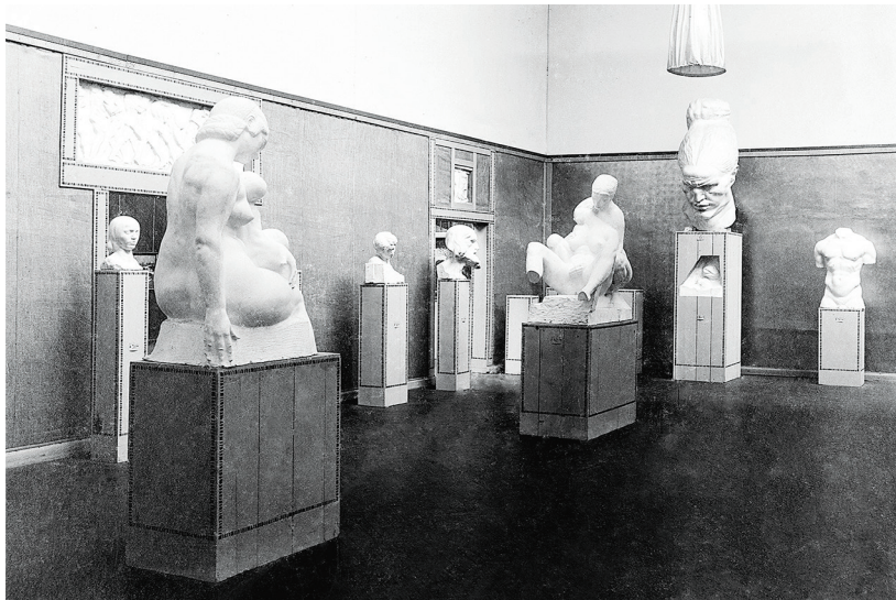
Slika 3 Postav samostalne izložbe Ivana Meštrovića, XXXV. izložba Secesije u Beču, 1910.