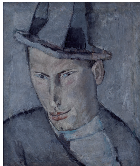
Slika 10 Marino Tartaglia, Portret Mate Meneghella Rodića , 1919. ulje na platnu, 33 × 28 cm, Galerija umjetnina Split, inv. br. 723