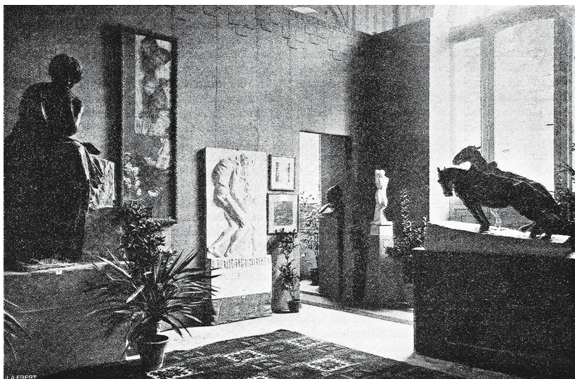
Slika 5 Postav izložbe u paviljonu Kraljevine Srbije , Međunarodna izložba, Rim, 1911. Fototeka Galerije Meštrović, Split, FGM-975