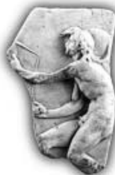
Kairos, 1. st. pr. Kr., Samostan sv. Nikole, Trogir.

In conclusion, the author indicates global guidelines that, within tourist offer, both enable preservation of the resources of cultural heritage and open up the ways to guarantee the authenticity, integrity, and quality of the cultural and tourist product.