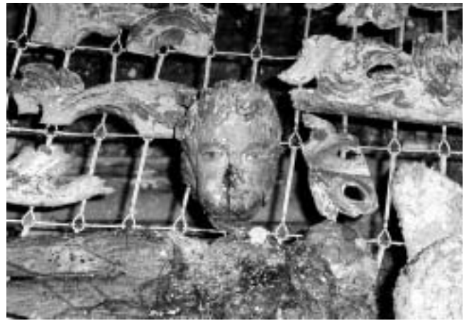
Kamensko, Pavlinski samostan — detalji oštećenih oltara. Crkva demolirana, srušeni svodovi i toranj za okupacije. Obnavlja Hrvatski restauratorski zavod.