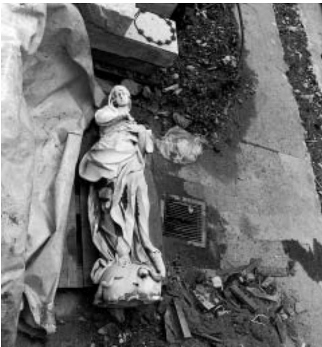
Karlovac, »Zvijezda« — mramorni kip Bezgrješne kipara Francesca Robbe s pila na trgu Bana Jelačića prije prenosa u Hrvatski restauratorski zavod gdje je obnovljen.