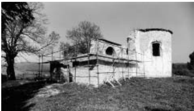
Divuša, kapela sv. Katarine — dogradnja zbog zvonika koji nagrđuje izvorni oblik trikonhosa.