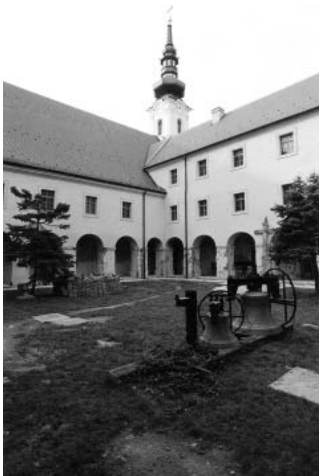
Vukovar — klaustar franjevačkog samostana. Južno krilo / hodnik uz crkvu.

Vukovar — Klaustar franjevačkog samostana nakon obnove samostana.