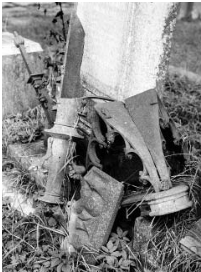
Jasenovac — devastirani spomenici katoličkog groblja.