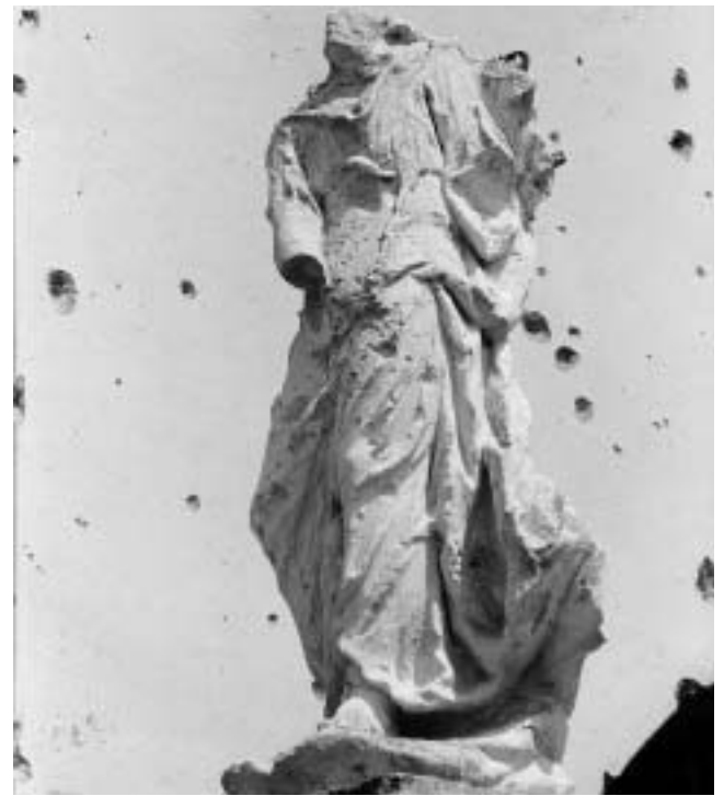
Vukovar — Kip pred pročeljem Crkve sv. Filipa i Jakova. Oštećena skulptura na pilu desno uz zvonik.