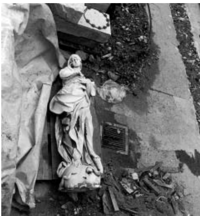
Karlovac, »Zvijezda« — mramorni kip Bezgrješne kipara Francesca Robbe s pila na trgu Bana Jelačića prije prenosa u Hrvatski restauratorski zavod gdje je obnovljen.