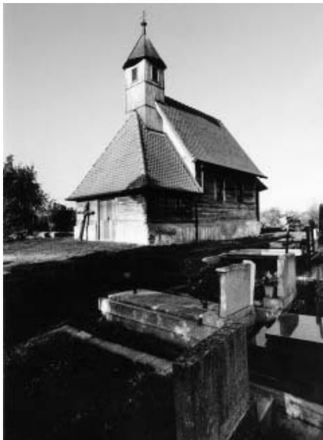
Brest — rekonstruirana kapela sv. Barbare.