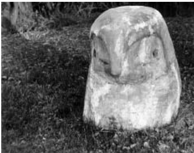
Milena Lah, Kobac — skulptura u vrtu ispred dvorca prije i nakon uništenja.