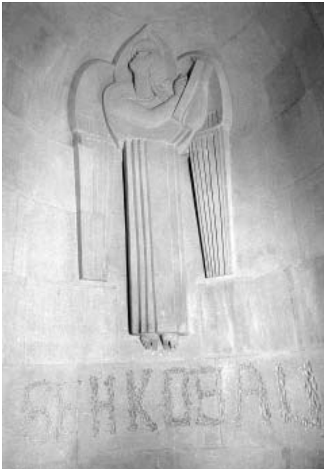
Ivan Meštrović, Evangelist Matej — ugrebeni ćirilčni natpis u Mauzoleju obitelji Meštrović u Otavicama.