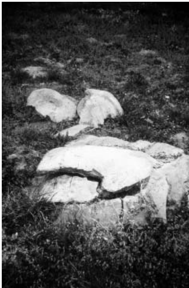
Ivan Meštrović, Porodjenje — uništeni reljef zatečen na stubištu Muzeja nakon oslobođenja.