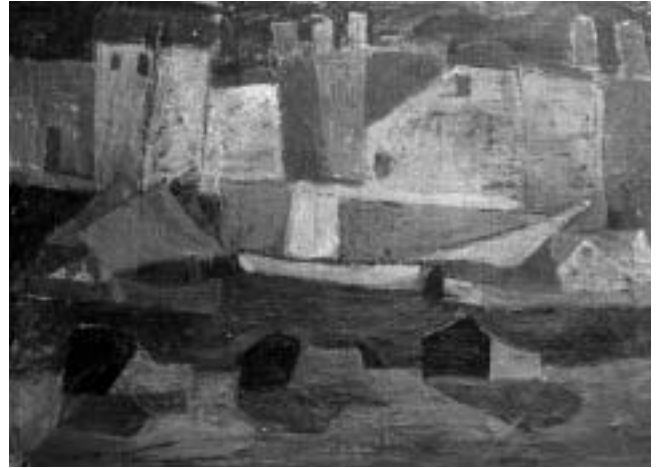
Zora Matić, Motiv iz Rovinja, 1951., ulje na platnu, 730x1010 mm, Zavičajni muzej grada Rovinja, foto: Damir Matošević.