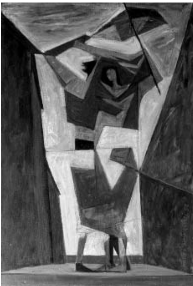
Zora Matić, Obala P. Budicin, 1953., ulje na platnu, 600x450 mm, Zavičajni muzej grada Rovinja.