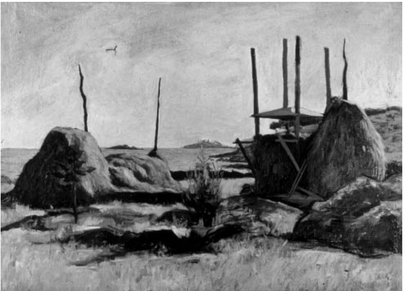
Bruno Mascarelli, Motivo campestre a Polari, 1950., ulje na - platnu, 550x800 mm, Zavičajni muzej grada Rovinja, foto: Damir Matošević.